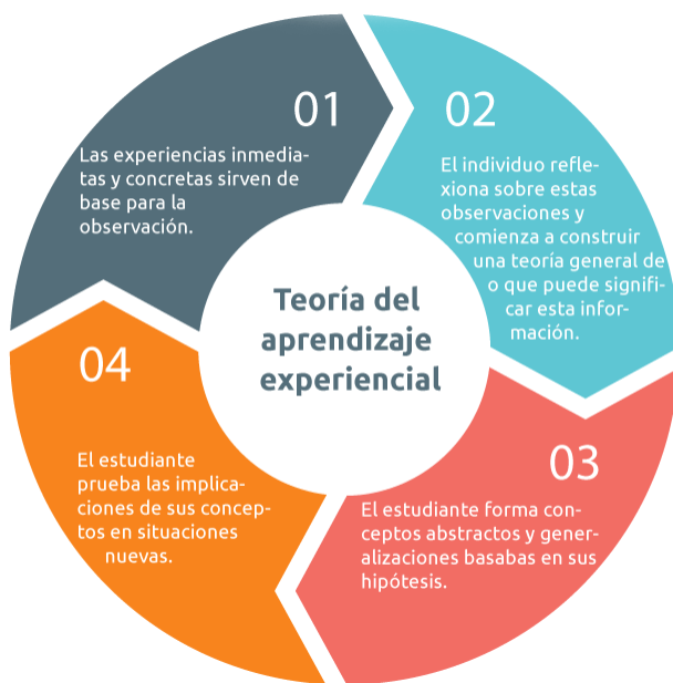
Ilustración 1 GRÁFICO 1

NOTA: TEORIA DEL APRENDIZAJE EXPERENCIAL