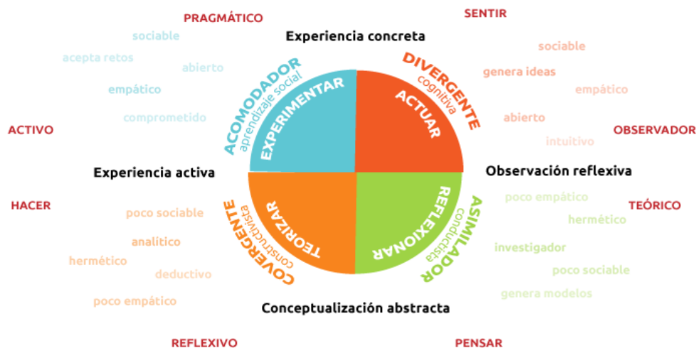
Ilustración 2 GRÁFICO 2

Encontramos también cuatro estilos de aprendizaje que (Kolb, 1984) identificó, cada uno de estos con particularidades que a continuación esquematizamos en la figura 2.