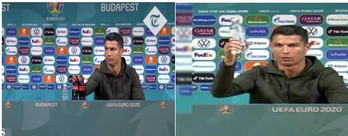
Imagen 5. Futbolista Ronaldo rechaza coca cola por agua