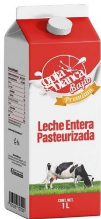
Imagen 34. Alimentos procesados