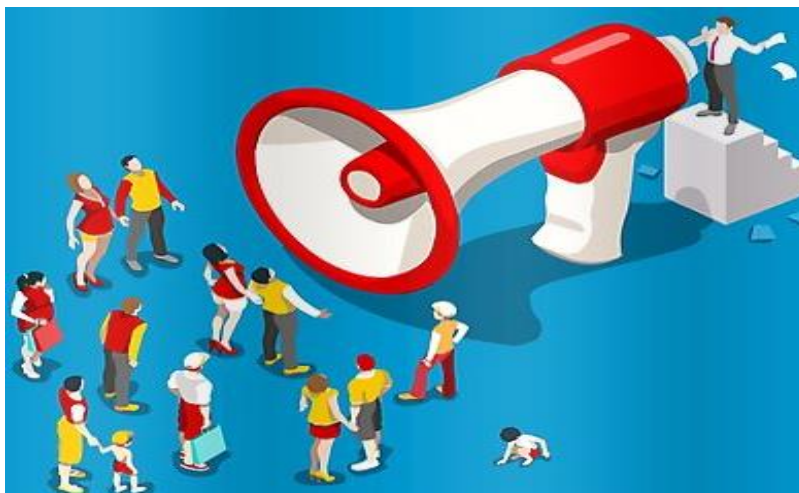
Imagen 14. Práctica de la observación