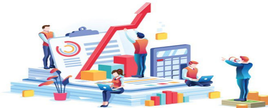
Imagen 18. Práctica de la aplicación