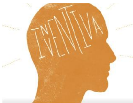
Imagen 19.Práctica inventiva

Prácticas de inventiva: Aquí se le brinda al estudiante la oportunidad de crear, imaginar, pero siempre se requiere de la información de la interpretación y de análisis de los temas con lo que se puede desarrollar la practica ya que de lo contrario se dificulta el desarrollo de esta práctica