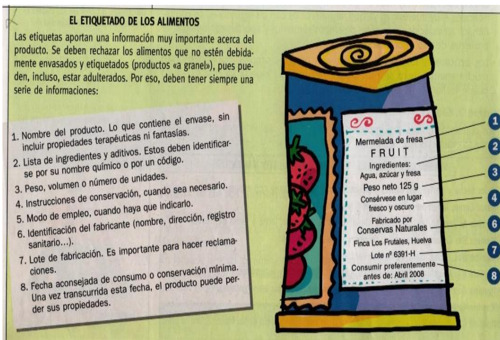
Imagen 31. Rotulado de los alimentos