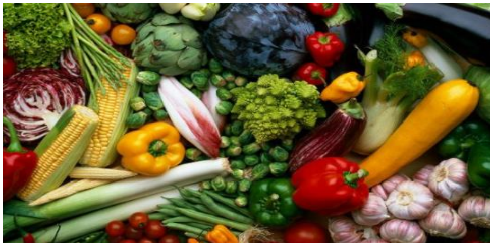
Imagen 33. Alimentos naturales