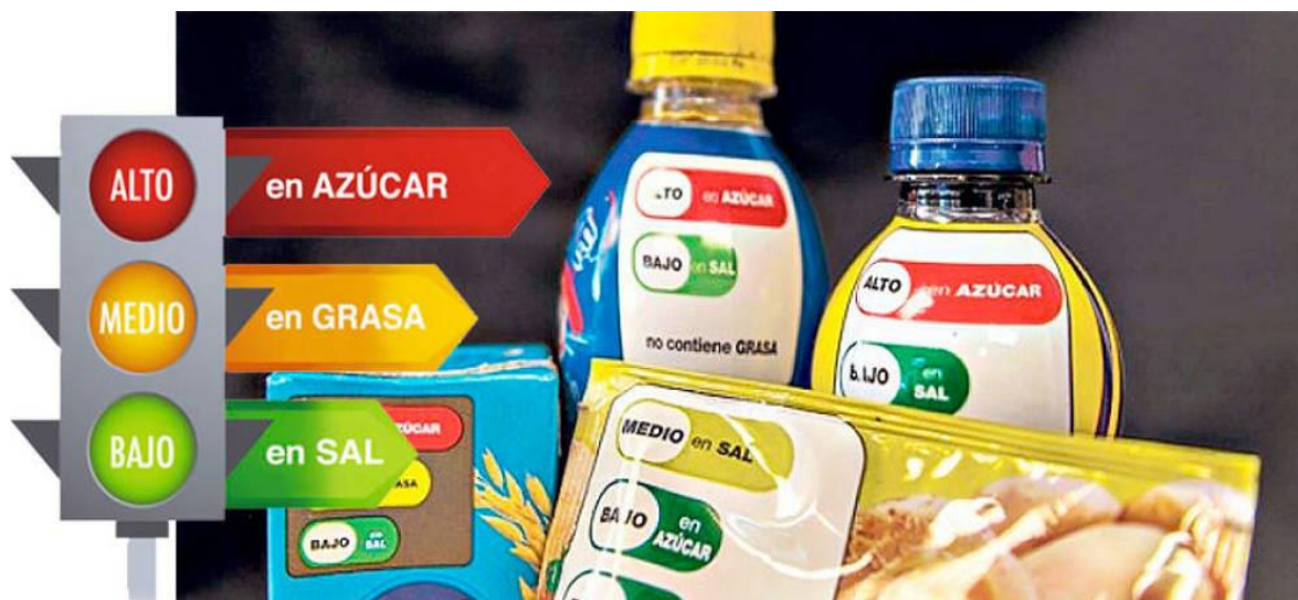
Imagen 4. Etiquetado en los alimentos