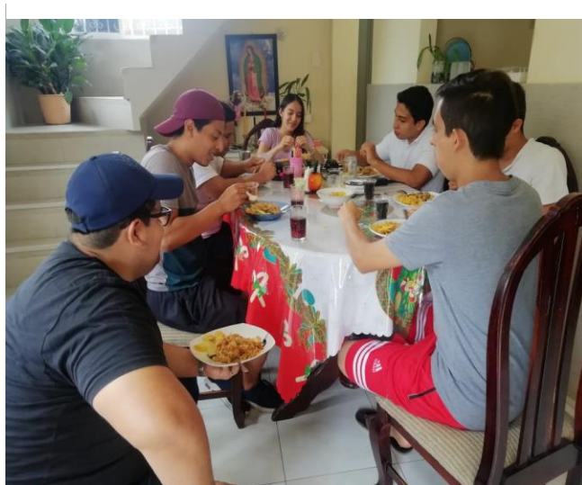
Imagen 27. Compartiendo con los jovenes un almuerzo