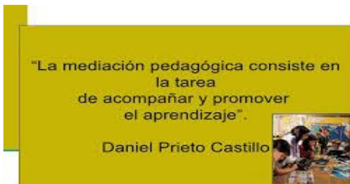
Imagen 2. La Mediación pedagógica