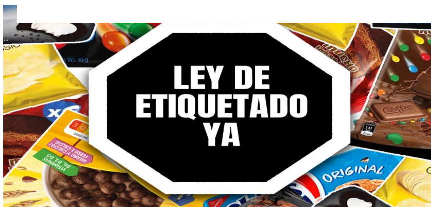
Imagen 32. Ley de etiquetado