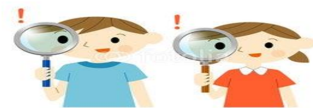
Imagen 15. Práctica de la interacción