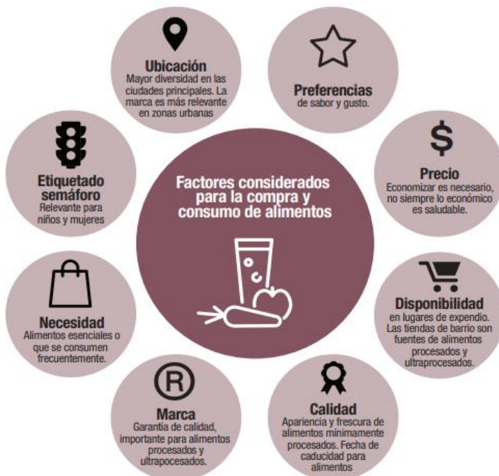
Gráfico 2. Factores que se consideran para la compra y el consumo de alimentos