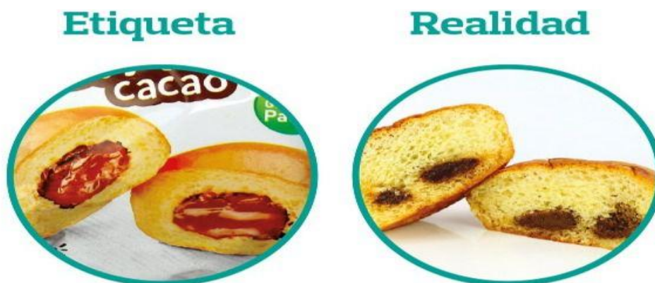
Imagen 29. Publicidad engañosa

Publicidad Engañosa. - Toda modalidad de información o comunicación de carácter comercial, cuyo contenido sea total o parcialmente contrario a las condiciones reales o de adquisición de los bienes y servicios ofrecidos o que utilice textos, diálogos, sonidos, imágenes o descripciones que directa o indirectamente, e incluso por omisión de datos esenciales del producto, induzca a engaño, error o confusión al consumidor