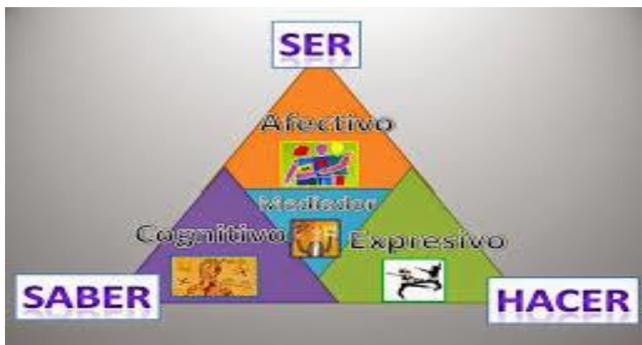
Imagen 12. Los tres saberes en la educación