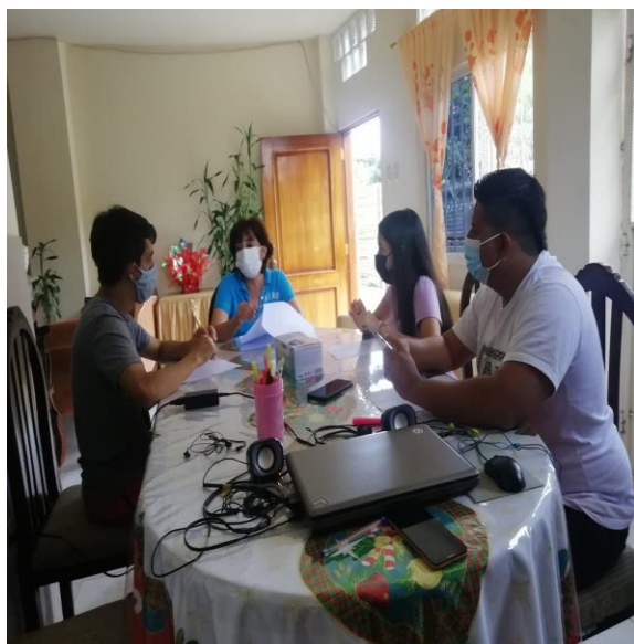
Imagen 25. Conversando con los jovenes