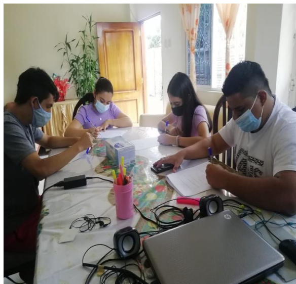
Imagen 26. Jovenes contestando encuesta