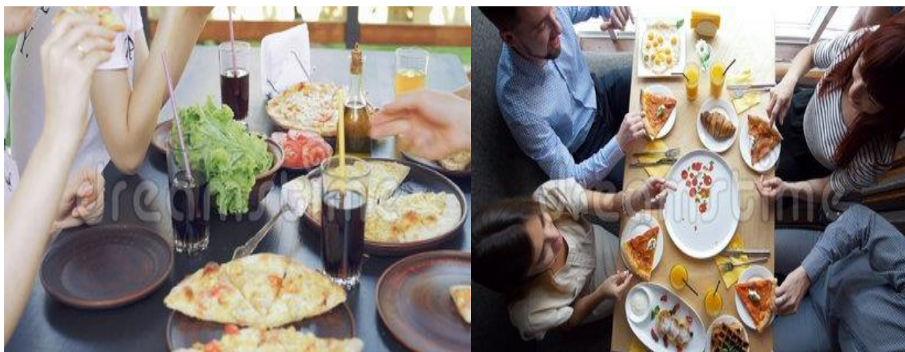
Imagen 24. Jóvenes comparten almuerzo donde prefieren comida rápida