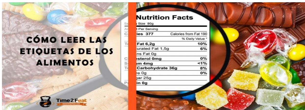
Imagen 23. Como leer las etiquetas de los alimentos