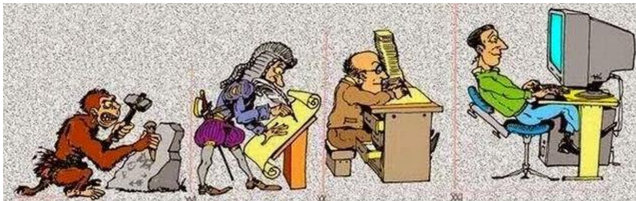
Imagen 7. Los cambios en la cultura