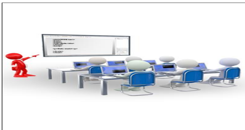
Imagen 20. Docente en clase

Determina la manera en que se utiliza el lenguaje en las diversas situaciones de la comunicación, le corresponde al participante organizar su texto para poder expresar su mensaje.