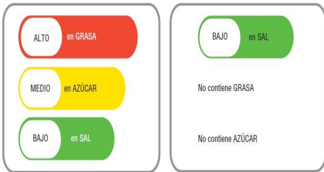
Imagen 3. Semáforo de los alimentos