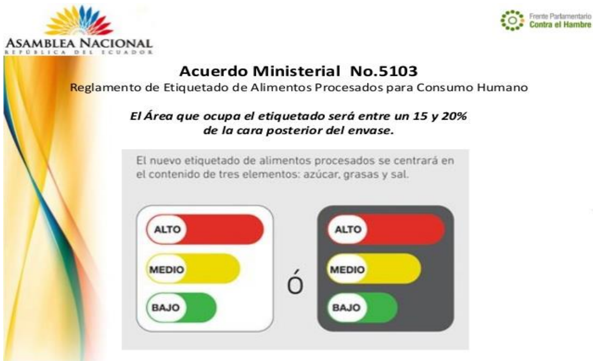
Imagen 11. Forma del etiquetado en los alimentos