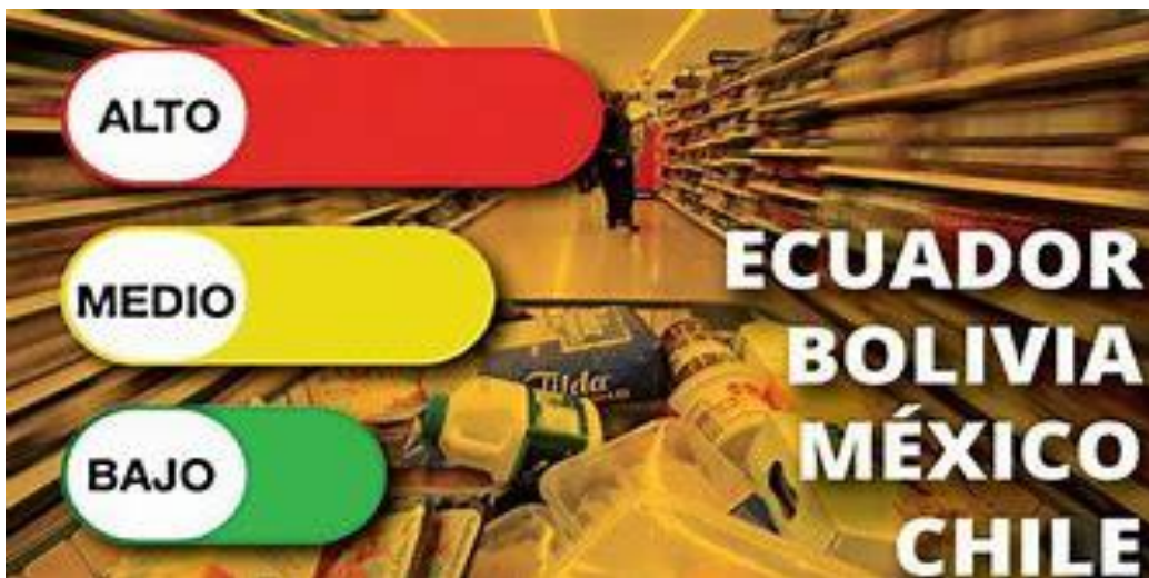
Imagen 22. Países con etiquetado de alimentos