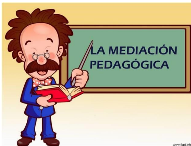
Imagen 1. El docente