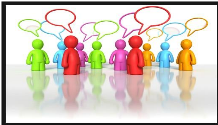
Imagen 16. La reflexión