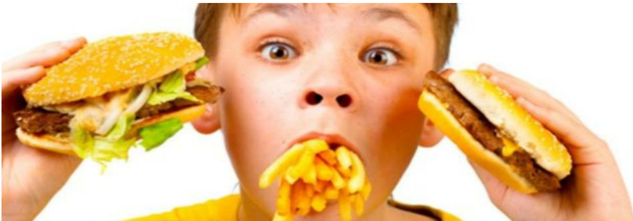
Imagen 28. Publicidad abusiva