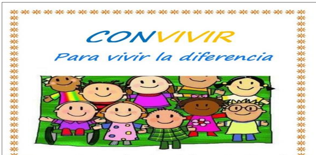
Imagen 6. Educar para convivir