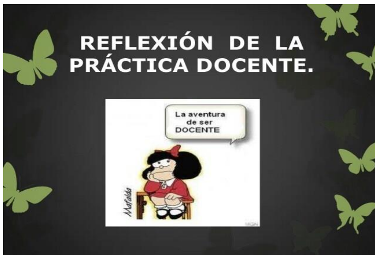
Imagen 17. La docente Mafalda