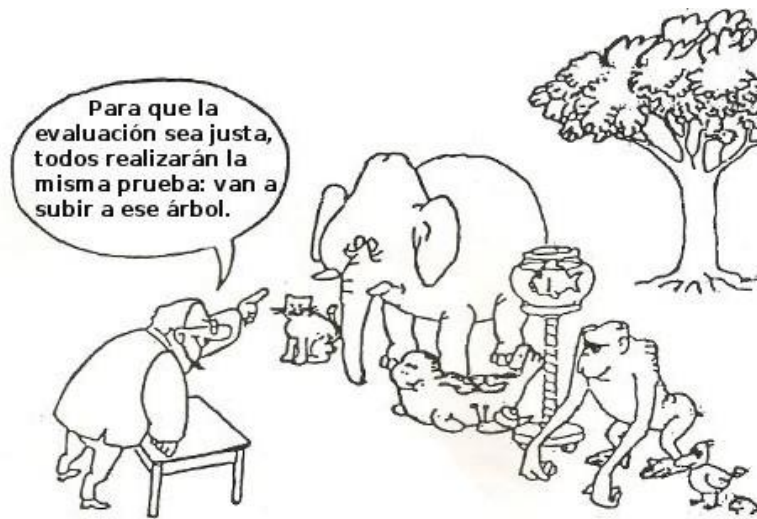
Ilustración cortesía de Miguel Ángel Santos Guerra