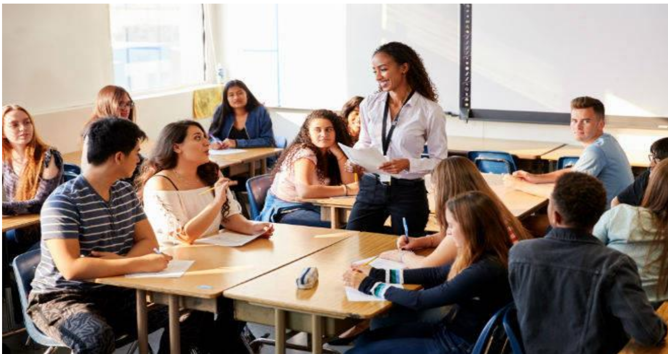
Figura N°3: Acompañamiento pedagógico

Fuente: Google. (s.f.). [Experiencias de observación y acompañamiento pedagógico] Recuperado el 10 de enero, 2021, https://www.unir.net/educacion/revista/ejemplos-de-experiencias-de-observacion-en-el-aula-de-educacion-secundaria/