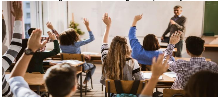
Figura N°6: Metodología del aprendizaje