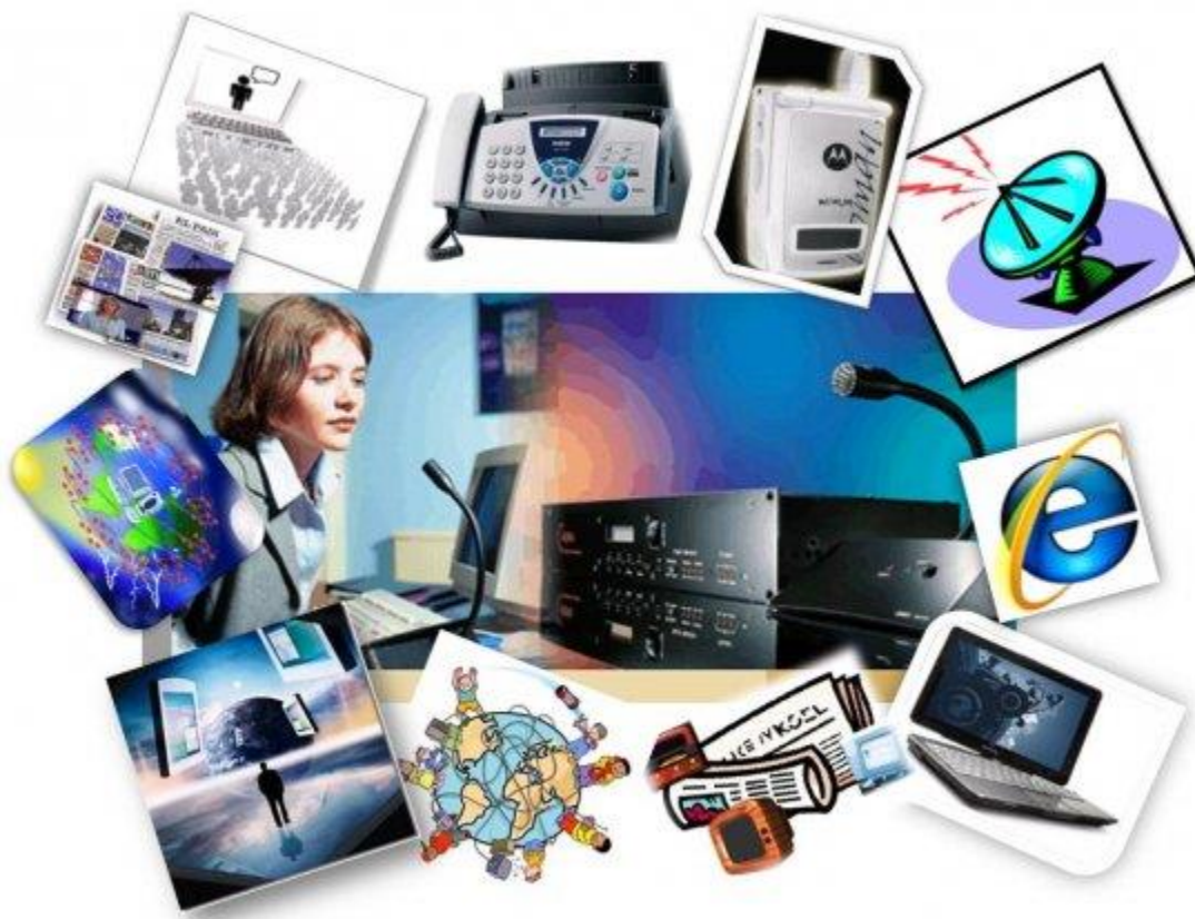
Figura N° 9: Evolución de los medios de comunicación