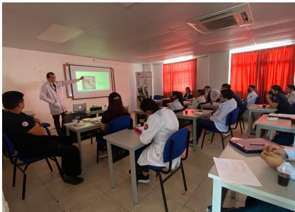
Figura N°5: Enseñando a futuros médicos