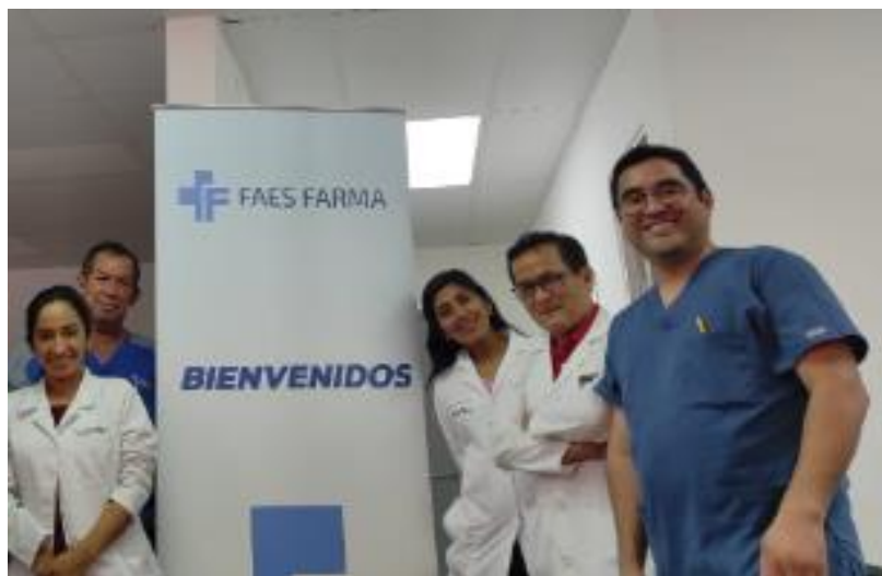
Figura N° 12: Experiencia pedagógica