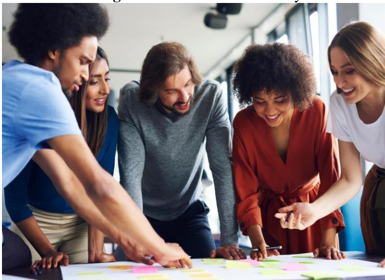
Figura N° 7: Valores sociales y éticos