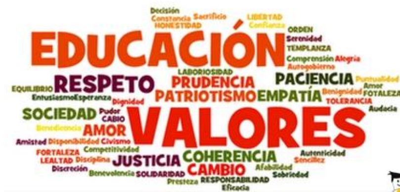
Figura N° 10: Educación en valores