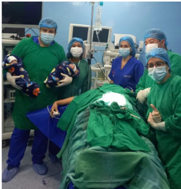
Figura N° 13: Experiencia pedagógica decisiva