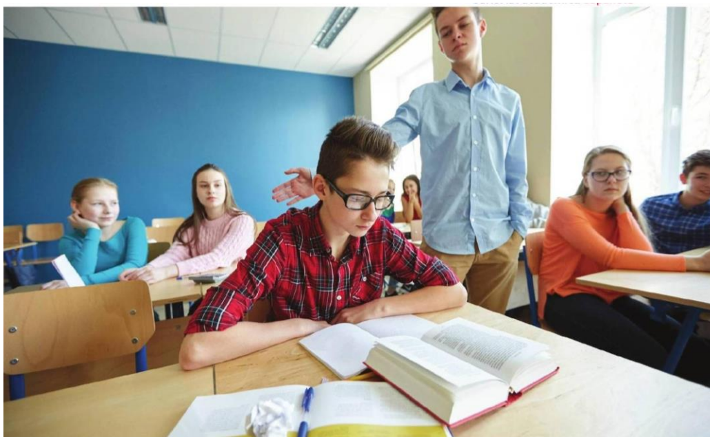
Figura N°4: Violencia en la educación