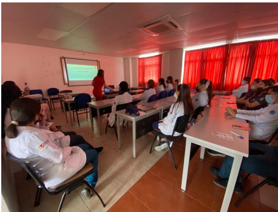
Figura N° 11: Diálogo con el internado rotativo