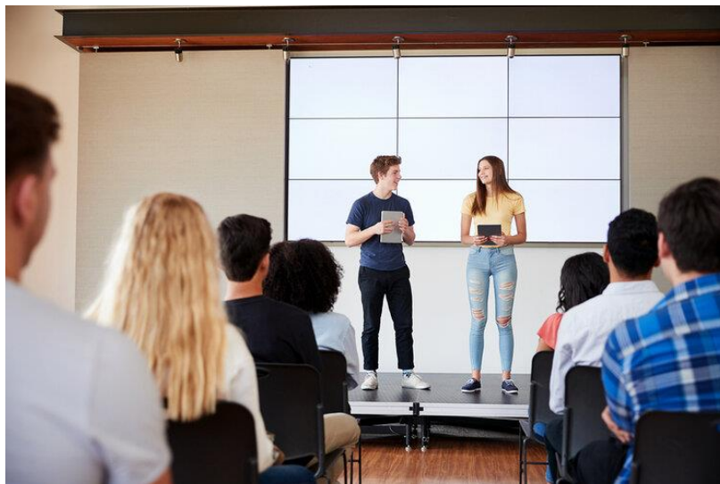
Figura N°2: Interactuando con los jóvenes