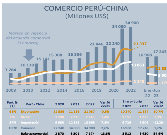
Figura 2: Comercio entre China y Perú desde el 2008 hasta el 2023