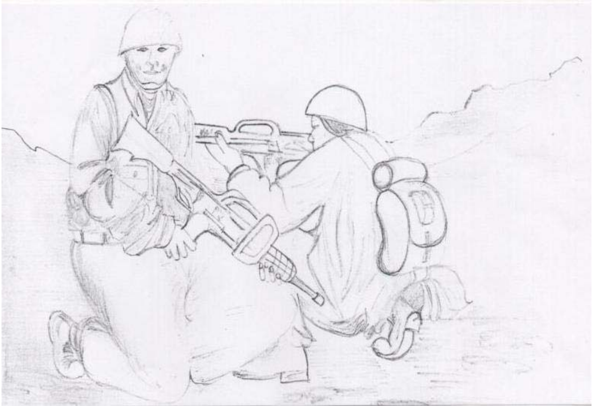
Figure 12

Provincia del Azuay, Cantón Cuenca, Parroquia San Joaquín, Comunidad de Soldados Costumbres y Tradición Oral