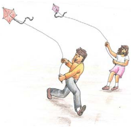
Figure 11

Actualmente en épocas de cometas (julio-agosto) toma gran impulso este juego. Se confeccionan para la venta en variedades de colores y tamaños.