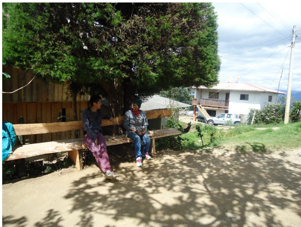
Fig. N° 4.- Sra. Digna Godoy hablándonos de las técnicas que utiliza según el doliente.