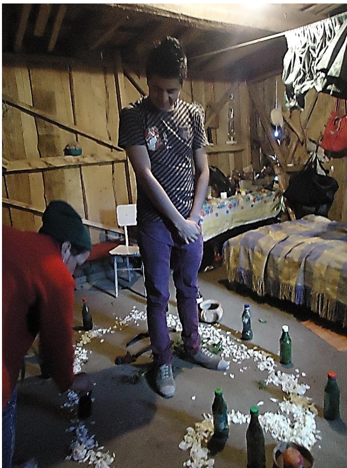
Figura N° 12.- Preparación para la limpia.