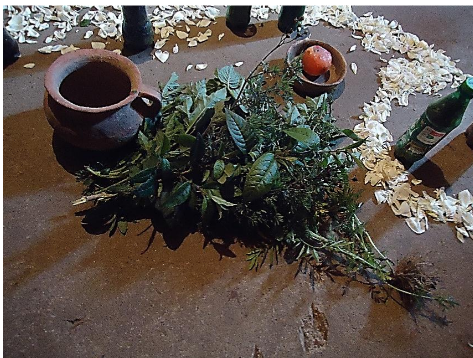
Figura N° 11.- Elementos para la limpia de sanación.