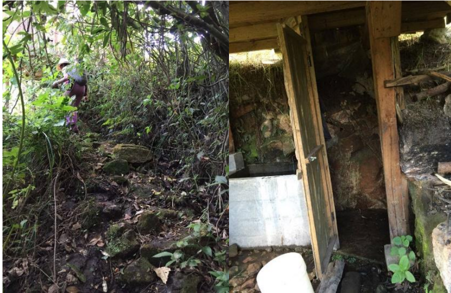
Figura N ° 8.- Camino hacia lugar de recogimiento de Lodo