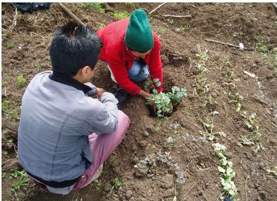
Figura N° 16.- Espacio dedicado a las plantas medicinales.