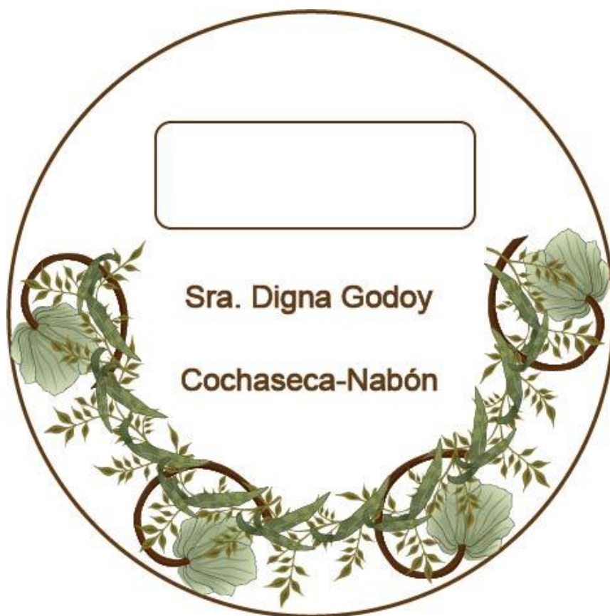
Figura N° 24.- Nueva presentación de cremas. Propuesta.