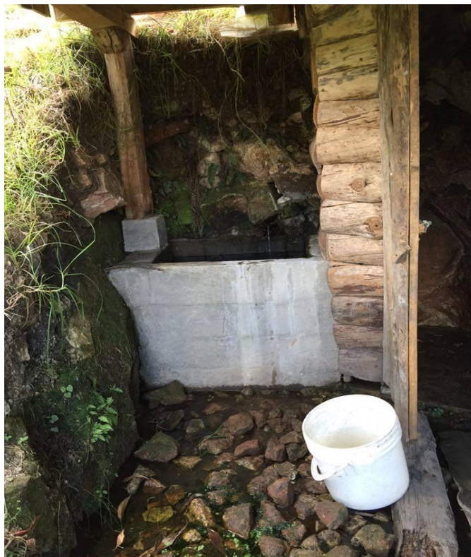
Figura N ° 7.- Espacio para el tratamiento con lodo.