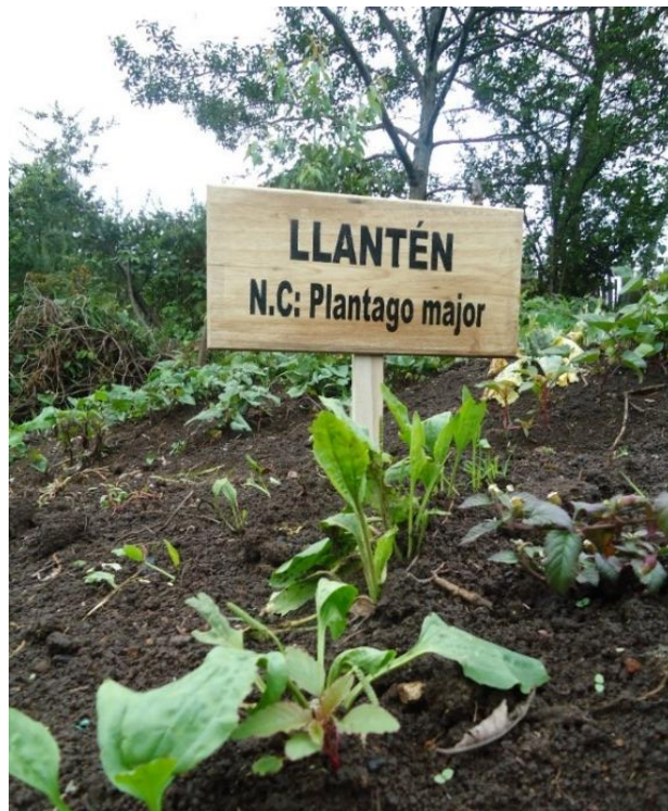
Figura N°18.- Planta medicinal con nombre común y científico en el huerto.