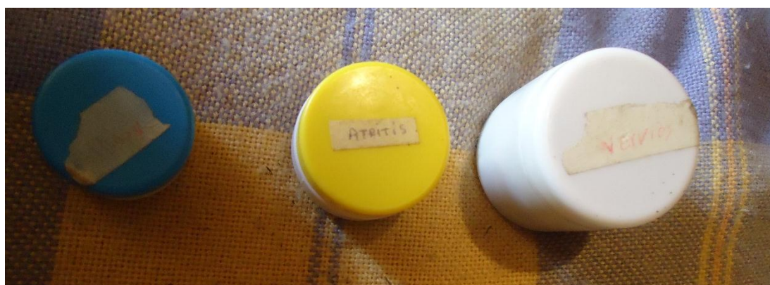
Figura N° 23.- Presentación actual de las cremas.