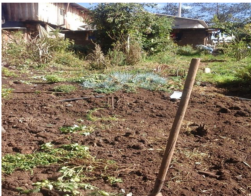
Figura N°14.-Espacio dedicado al huerto.