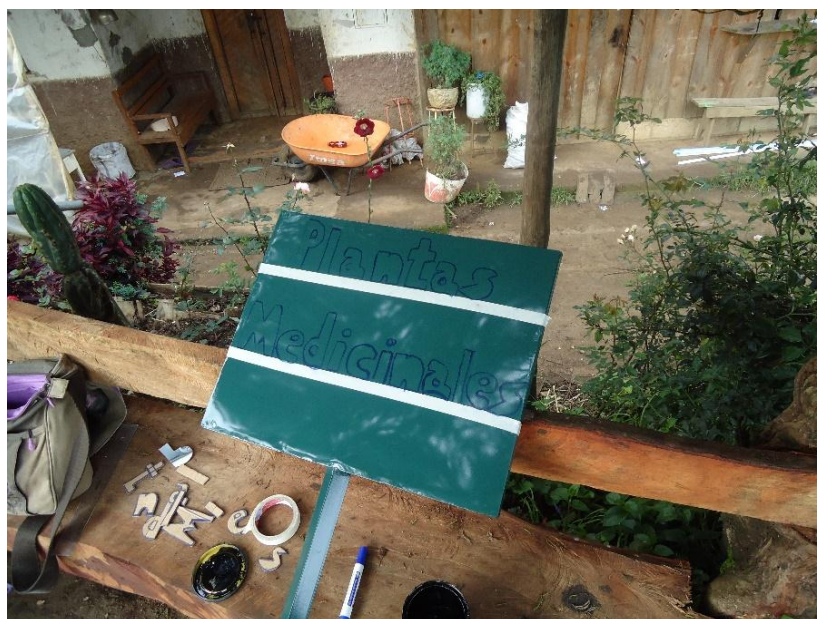
Figura N° 21.- Señalética, letrero informativo del huerto de la Sra. Digna Godoy.