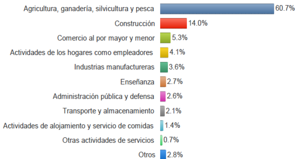
Figura N ° 3.- Población ocupada por rama de actividad.