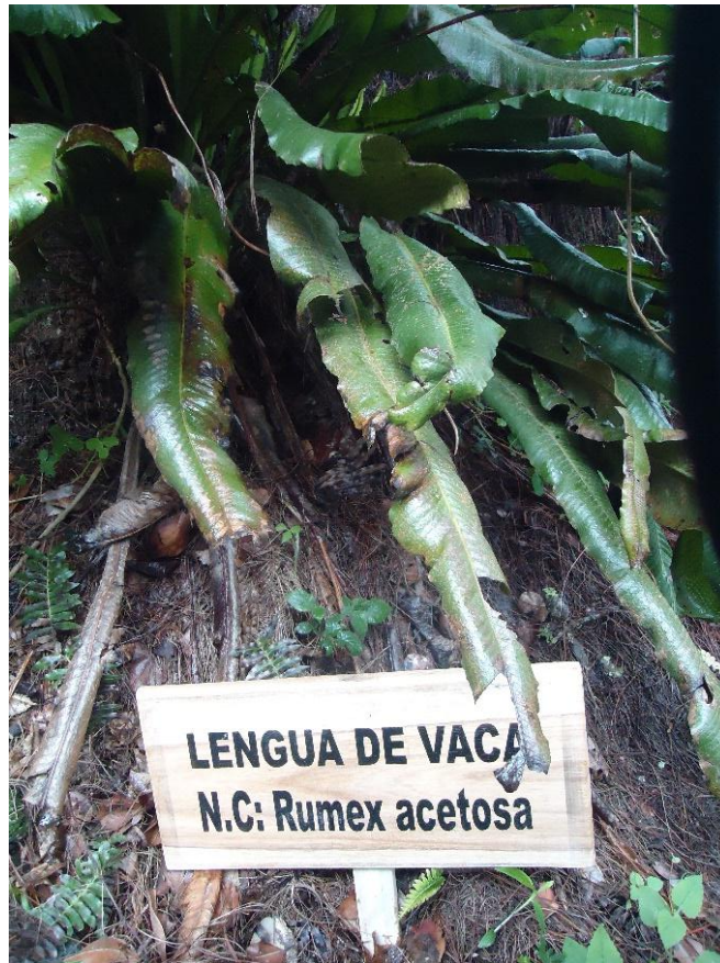
Figura N°10.- Planta de lengua de vaca con identificación.