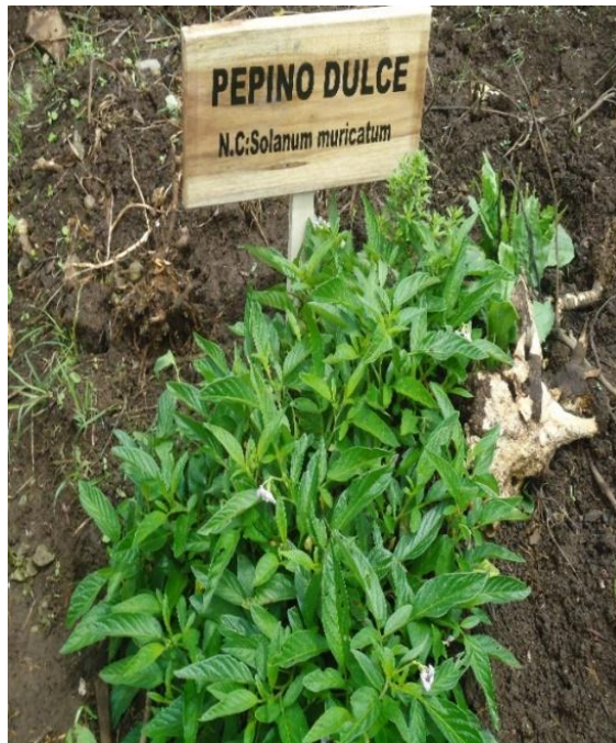
Figura N°17.- Planta de llantén en el huerto medicinal.