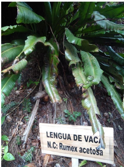
Figura N°19.- Planta medicinal silvestre con nombre común y científico.