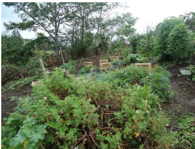
Figura N° 20.- Huerto Medicinal con cada una de las plantas medicinales.