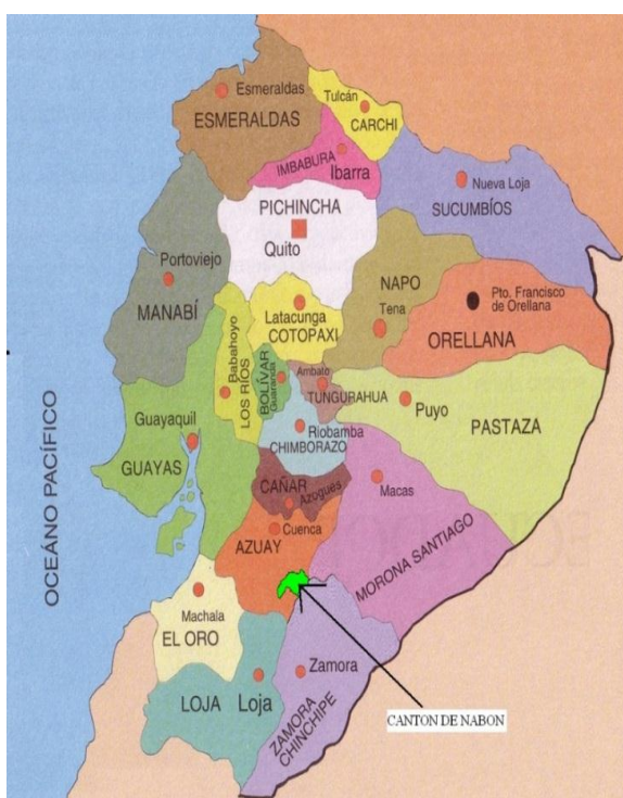
Figura N °1.-Ubicación de Cantón Nabón en Mapa Político del Ecuador