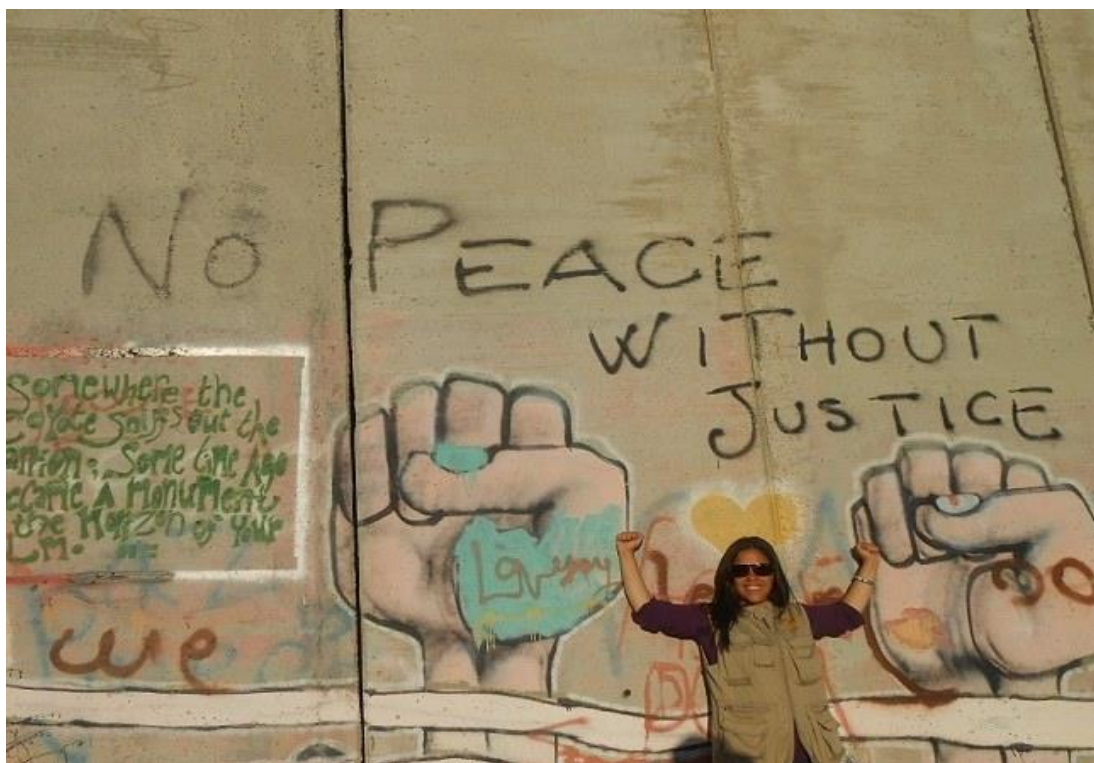
GRÁFICO NO. 18 “NO PEACE WITHOUT JUSTICE”