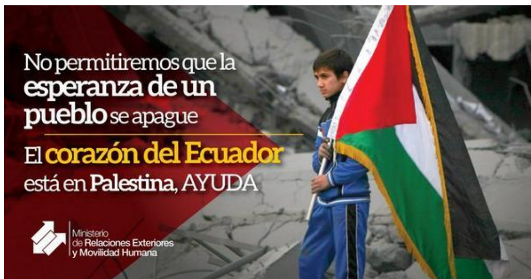
GRÁFICO NO. 15 ECUADOR CON PALESTINA