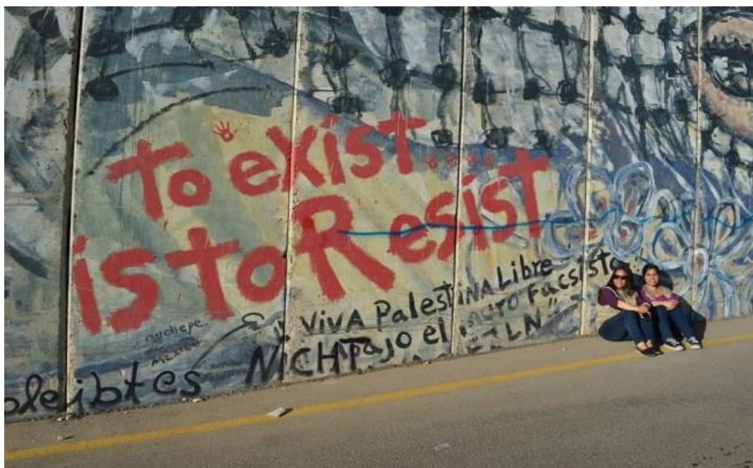
GRÁFICO NO. 17 VIVIENDO BAJO OCUPACIÓN