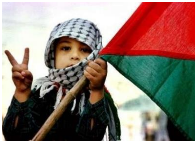
GRÁFICO NO. 8 PALESTINA LOGRA SER RECONOCIDO COMO ESTADO OBSERVADO ANTE LA ONU