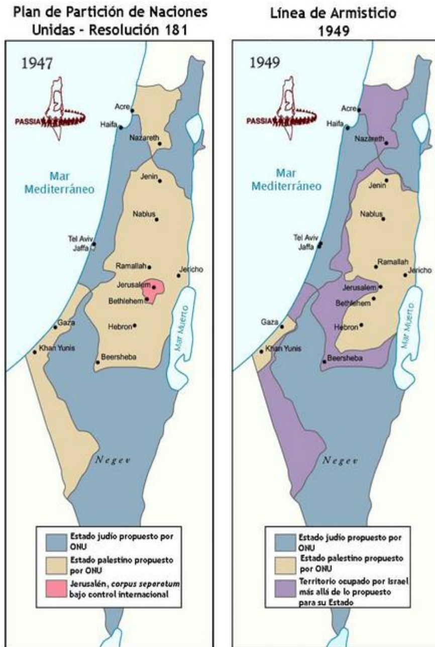
GRÁFICO NO. 3 PLAN DE PARTICIÓN DE NACIONES UNIDAS- RESOLUCIÓN 181/1947/ LÍNEA DE ARMISTICIO 1949