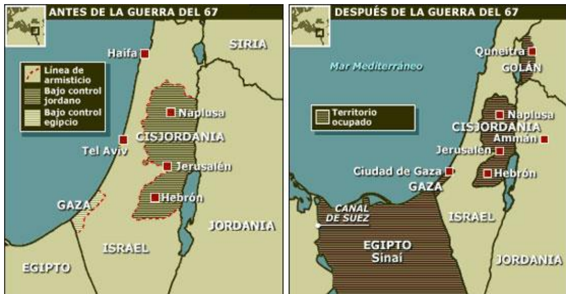
GRÁFICO NO. 6 SEIS DÍAS, UNA GUERRA QUE CAMBIO EL MEDIO ORIENTE