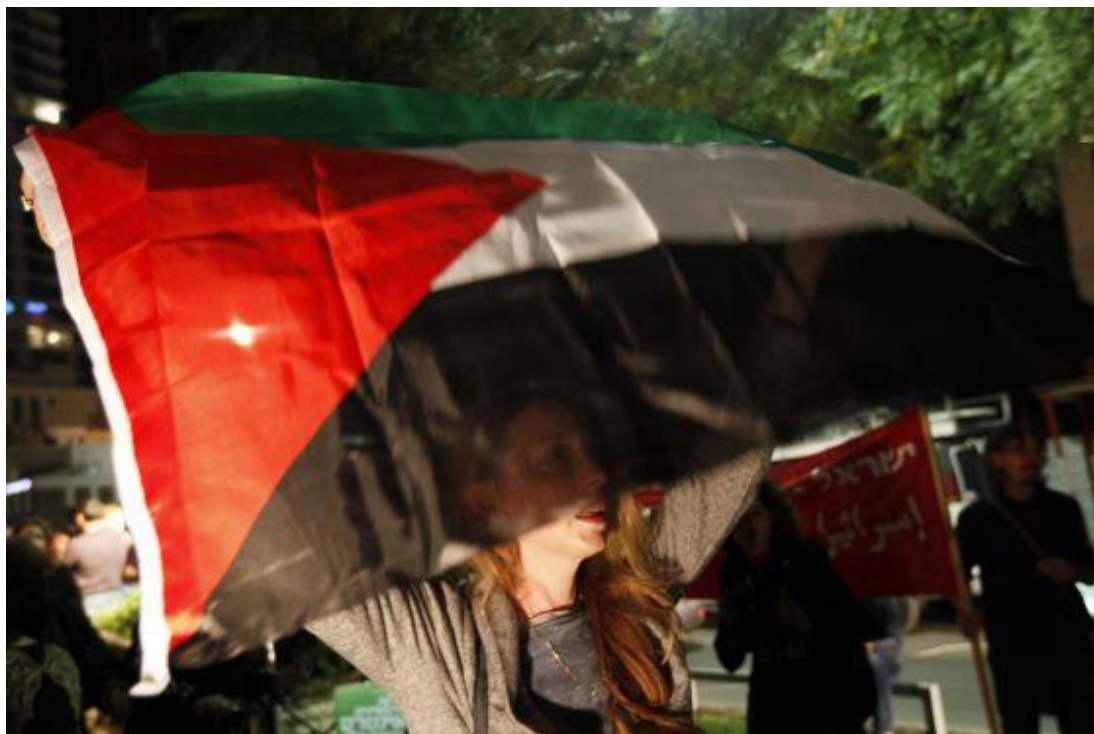
GRÁFICO NO. 9 LA ONU ACEPTA A PALESTINA