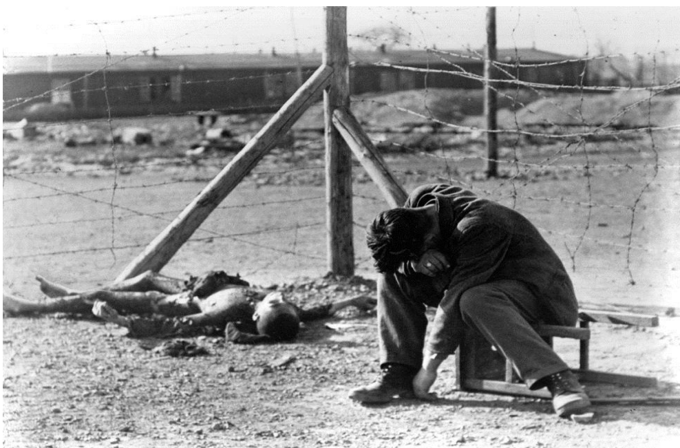
GRÁFICO NO. 1 EL HORROR DEL HOLOCAUSTO

Fuente: Foto Galería Diario El País Autor Margaret Bourke White (Getty). Disponible en: