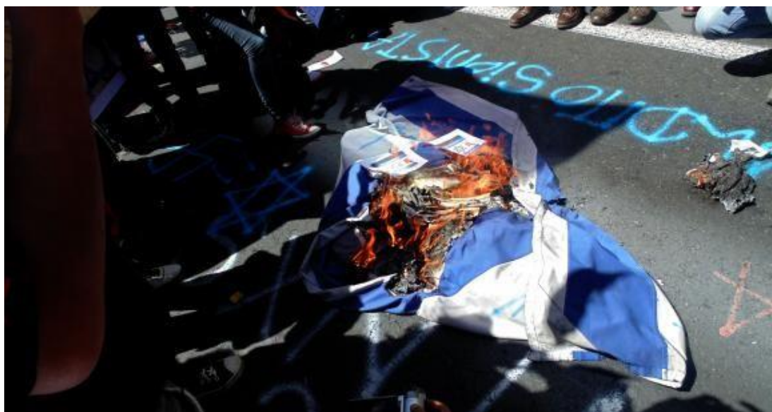
GRÁFICO NO. 16 MANIFESTANTES EN QUITO PIDEN AL GOBIERNO DE ECUADOR ROMPER RELACIONES CON ISRAEL.