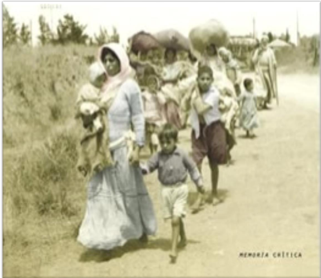
GRÁFICO NO. 4 LA LIMPIEZA ÉTNICA DE PALESTINA

Fuente Ilan Pappé " limpieza étnica de Palestina " España, 2008