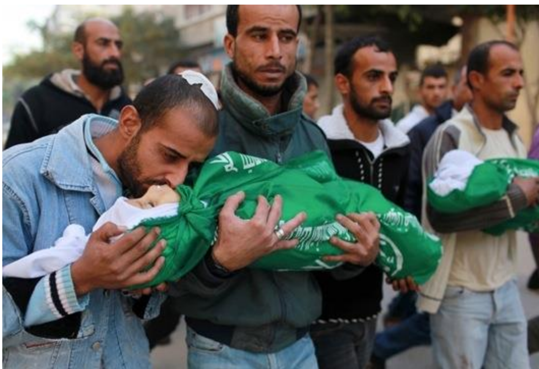
GRÁFICO NO. 13 MASACRE EN PALESTINA: “EE.UU Y SUS ALIADOS SON LOS RESPONSABLES DE LOS CRÍMENES ISRAELÍES EN GAZA”