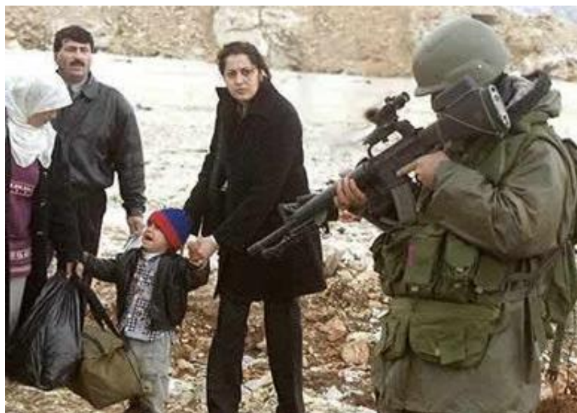
GRÁFICO NO. 14 ¿QUIÉN ES EL TERRORISTA? ISRAEL MATA A UN NIÑO PALESTINO CADA TRES DÍAS