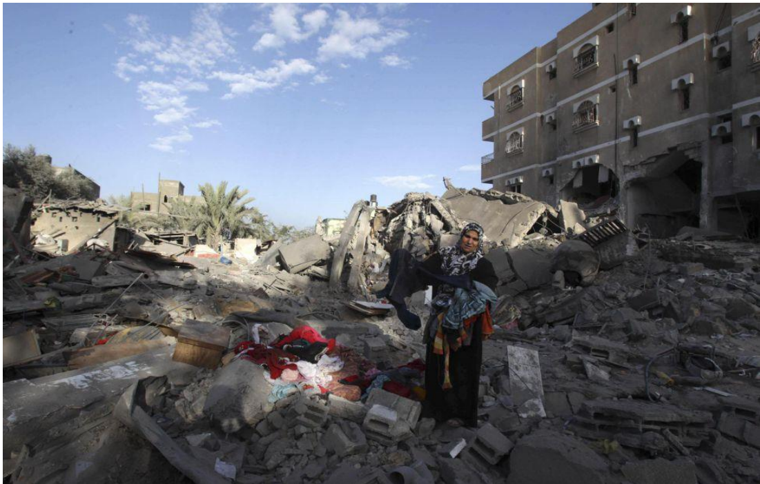
GRÁFICO NO. 11 LOS ROSTROS TRAS “PILAR DEFENSIVO”