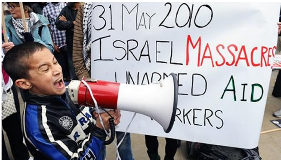
GRÁFICO NO. 10 EL ATAQUE ISRAELÍ A FLOTILLA DE AYUDA GENERA PROTESTAS INTERNACIONALES