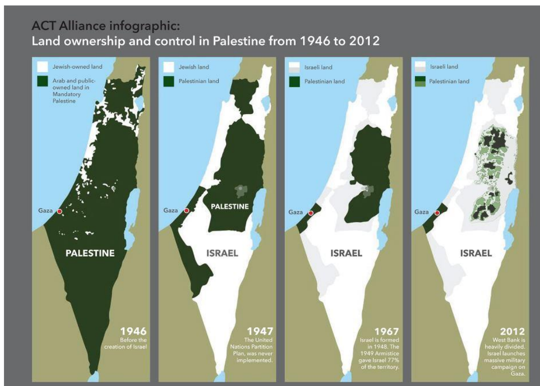
GRÁFICO NO. 7 PALESTINA EN EL CORAZÓN