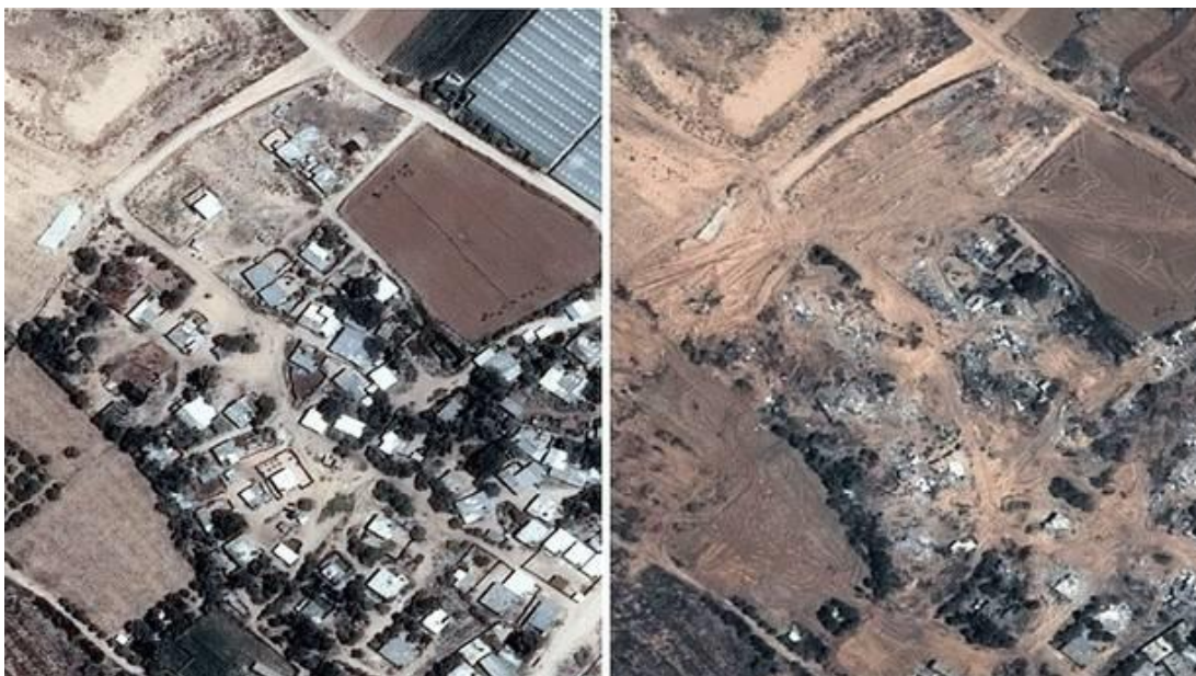
GRÁFICO NO. 12 GAZA ANTES Y DESPUÉS DE LOS ATAQUES