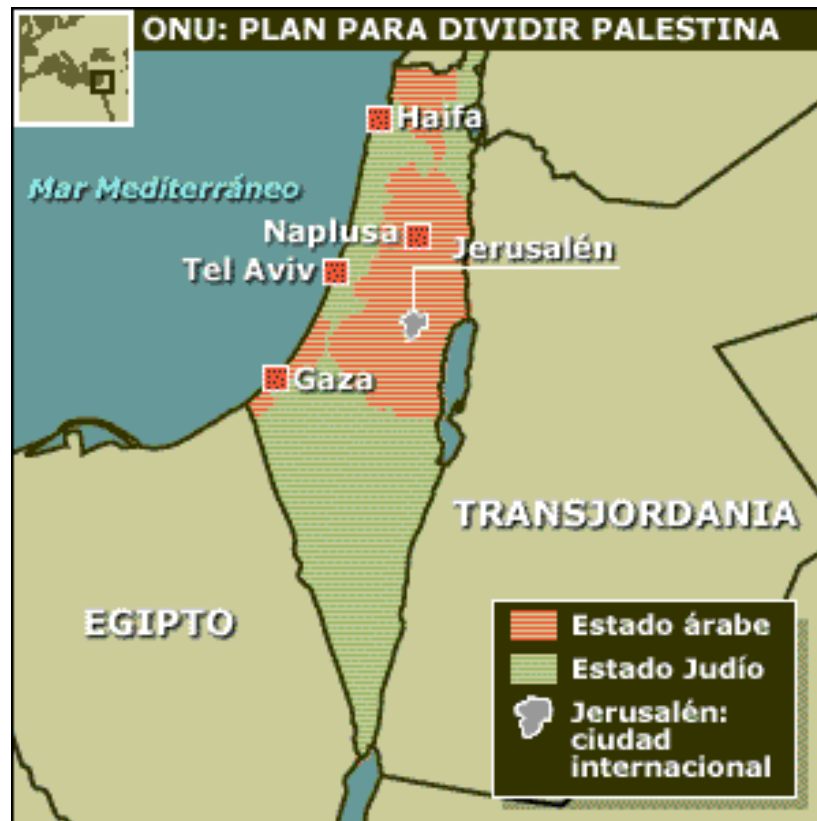
GRÁFICO NO. 2 ISRAEL Y LOS PALESTINOS