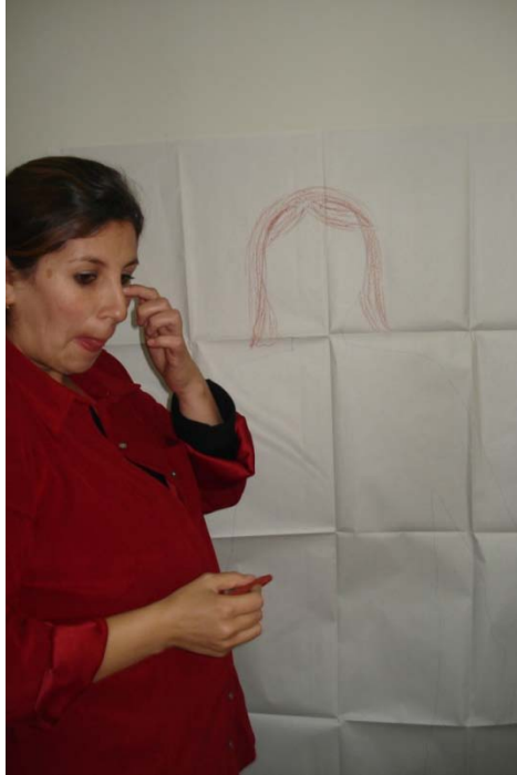
Las maestras trabajando en la decoración de su silueta.