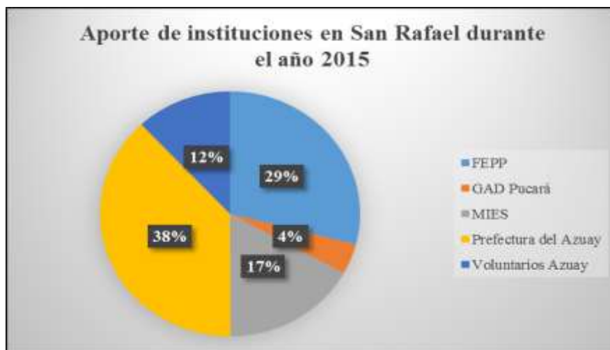
Ilustración 2 Participación de instituciones en los aportes realizados a San Rafael de Sharug en el año 2015