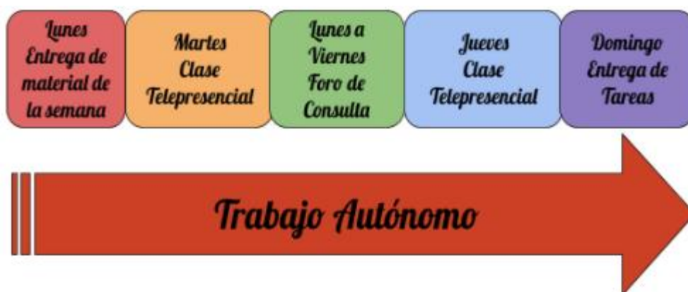
Figura 21. Planificación semanal, (Elaborado por Verónica Ayala, 2021)

La cátedra se dictará en la modalidad virtual y presencial, utilizando la metodología Microsoft Teams para las clases, los contenidos complementarios se pondrán en videos y archivos dentro de la plataforma Classroom google al inicio de cada semana, los estudiantes deberán resolver tareas en base a lo explicado en los videos realizados por el docente y los resolverán hasta el domingo. Cada tutorial tendrá un foro donde los estudiantes tendrán la oportunidad de aclarar dudas. La clase presencial virtual será dos veces por semana donde se realizarán los procedimientos prácticos y devoluciones, tomando en cuenta la planificación semanal.