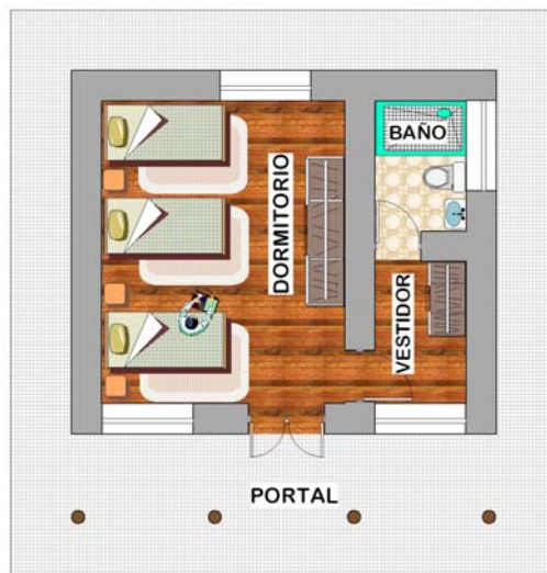
PLANTA DE CABAÑA