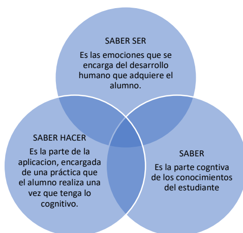
Gráfico 1 Tipos de saberes Autor: Espinoza, D. (2022)

Saber: Saber de orden cognitivo, teórico e intelectual. Este saber hace referencia a los conocimientos que adquirimos y poseemos sobre un determinado tema de estudio.