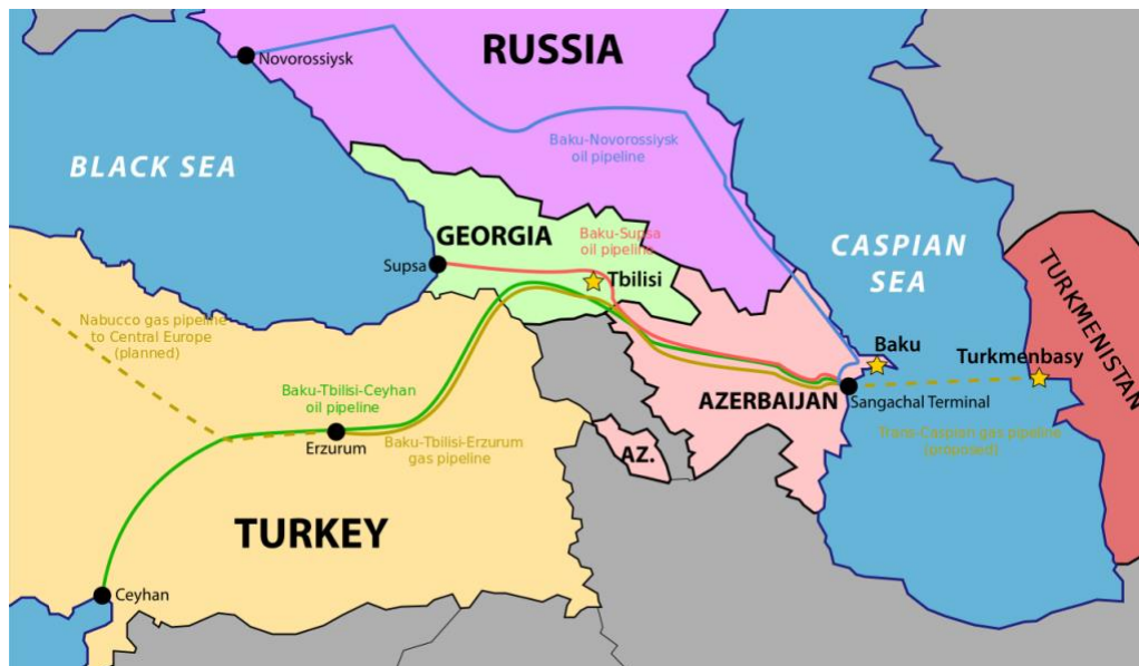
Gráfico 6: Principales oleoductos del Cáucaso Sur