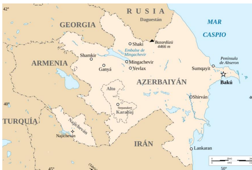
Gráfico 3: Ubicación Geográfica de Azerbaiyán