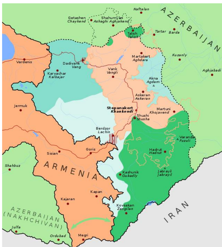
Gráfico 4: Sugerencia de Corredores entre los enclaves y sus respectivas naciones

Imagen referencial del resultado de conexiones en el acuerdo de 2020. El corredor de Lachin es la zona de líneas rojas que conecta Armenia y Nagorno-Karabaj. La flecha verde indica el actual corredor de Zangezur, que conecta Najichevan con Azerbaiyán, para 2001 este camino fue solo una propuesta que no pudo llegar a concretarse.