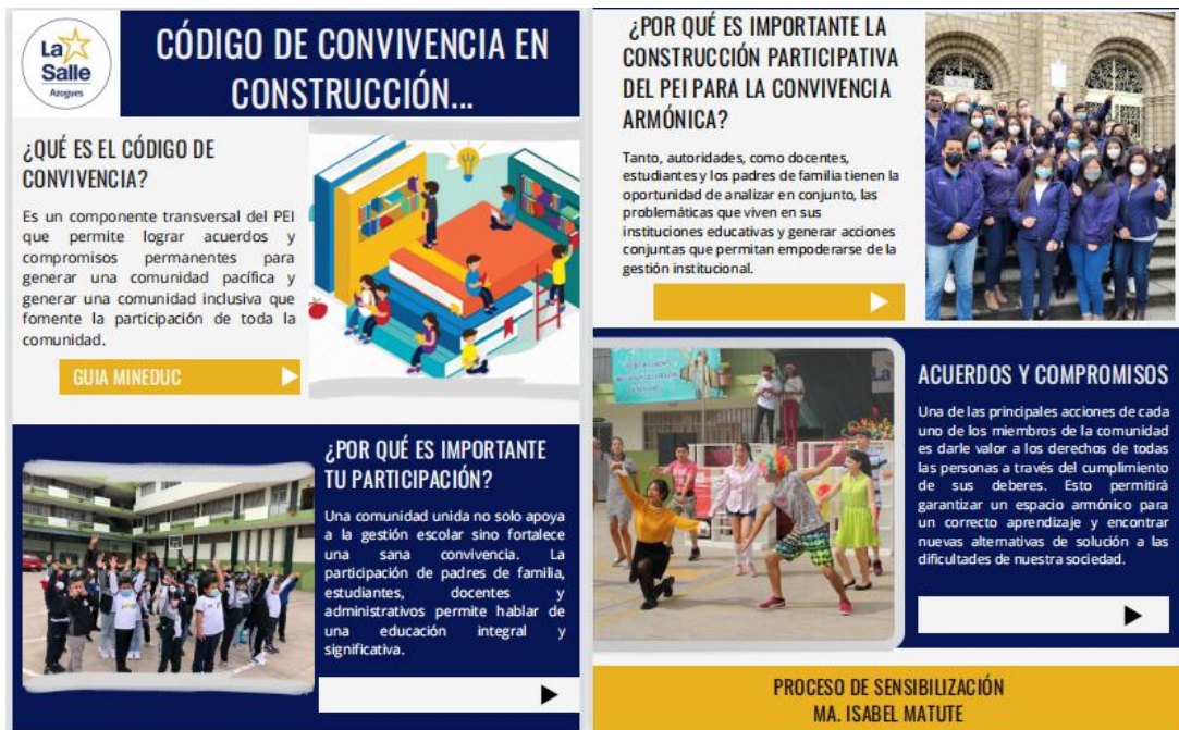
Imagen 3 Infografía para padres de familia