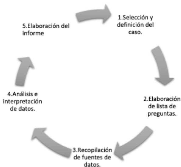
Ilustración 5 Proceso de la Metodología