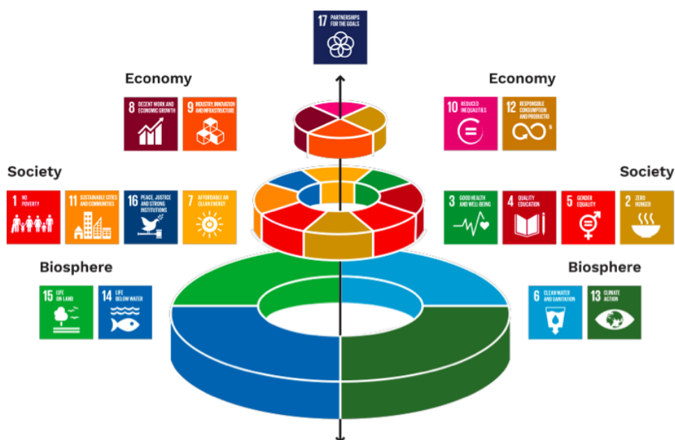
Ilustración 3 Objetivos de Desarrollo Sostenible

Fuente: UCLG, (s.f). Distribución de los ODS según sus áreas.