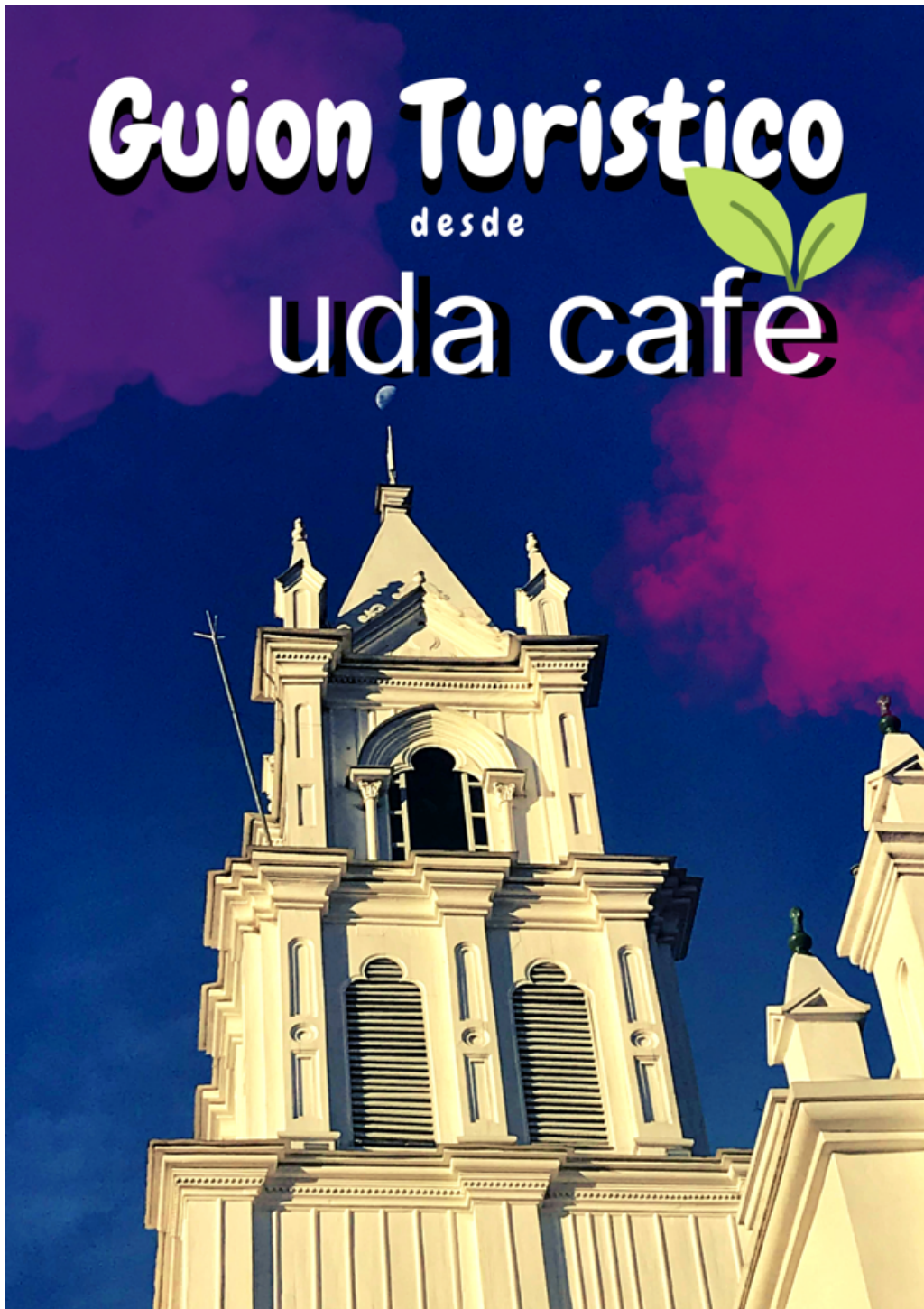
Portada del Guion Turístico para UDA Café en español