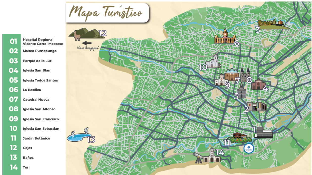
Mapa Turístico de la ciudad de Cuenca para el guion turístico