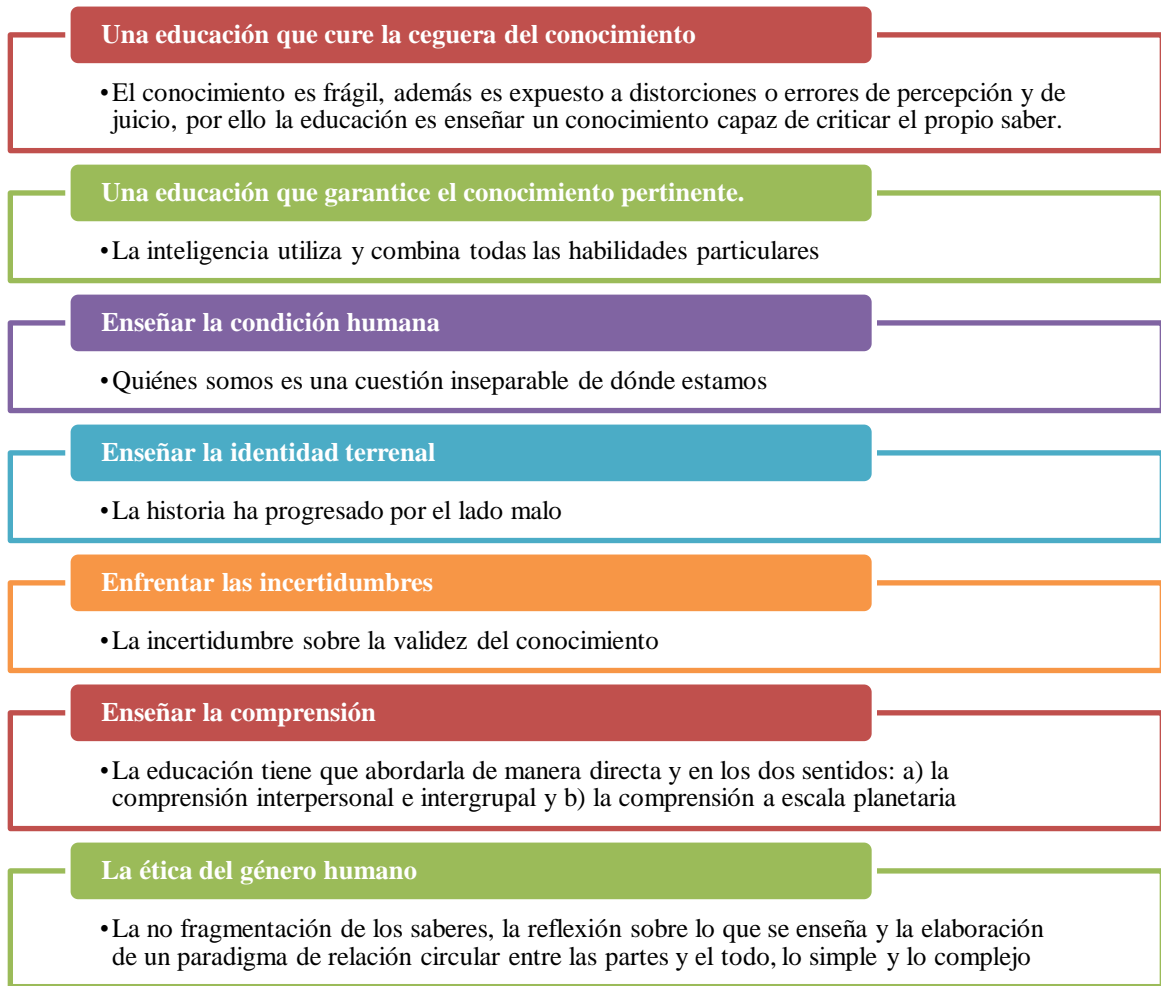
Figura 1. Siete saberes de Edgar Morín