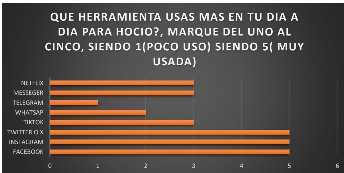
FIGURA 1 USO DE REDES SOCIALES

Acercas de las herramientas más utilizadas, les propongo un gráfico estadístico en el que se evidencia mucho mejor las respuestas.