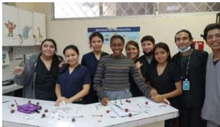
Equipo de estudiantes de medicina, cátedra presencial de oftalmología.