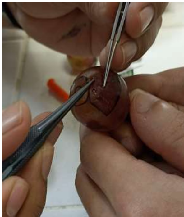
Sutura en uvas, manejo inicial, fuente directa, estudiantes de medicina.