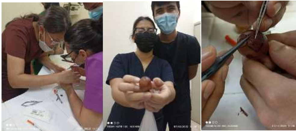
Prácticas para salir de la inhibición:

El proceso de construcción de conocimiento en el aula se lleva a cabo a través de interacciones discursivas facilitadas por la participación en actividades de aprendizaje conjunto, conformando así un acto educativo. Coll y Onrubia (2001) plantean que mediante el lenguaje las personas pueden representar sus conocimientos dando sentido a su experiencia y actividad, y al mismo tiempo compartirlos con otros; señalan que esa doble función, representativa y comunicativa del lenguaje, permite transformarlo en un instrumento privilegiado para pensar y aprender de y con los otros: conocimientos, experiencias, deseos, expectativas y significados. Este proceso brinda a las personas la