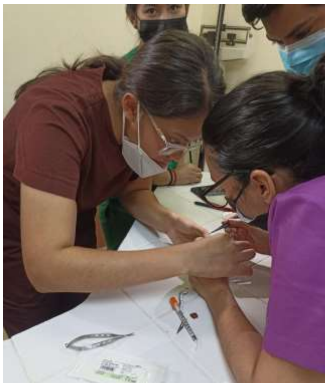
Práctica de sutura ocular, simulación en uvas, fuente directa, estudiantes medicina.