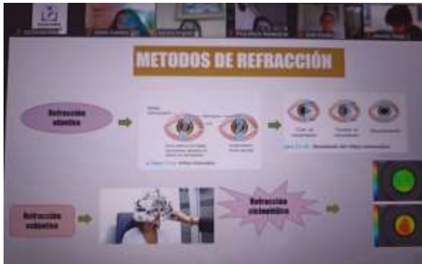
Figura 4: Exposición de conocimientos investigativos cátedra de oftalmología, área de la salud médica. Silvana Serpa