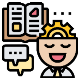
Figura 8. Elaborado por el autor

Morin (2003) manifiesta “La Universidad tiene que adaptarse, simultáneamente, a las necesidades de la sociedad” (p. 17), existen varias instancias del aprendizaje: con la institución, el educador, los medios, materiales y tecnologías, con el grupo, con el contexto y con uno mismo.