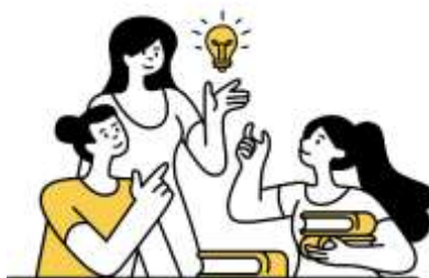
Figura 11. Elaborado por el autor

Prieto (2021) explica la importancia de tener una visión global del contenido en la pedagogía. Destaca las estrategias de entrada, desarrollo y cierre para impartir contenido, y la relevancia del lenguaje pedagógico para facilitar el acto educativo.