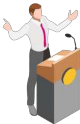
Figura 21. Elaborado por el autor

Al respecto, Prieto (2020) dice que la cultura mediática está formada por partes que se relacionan con un todo. La fragmentación constante se ha traducido en una reducción de la duración de los programas y del tamaño de los artículos y noticias escritas. Los que interactúan a diario con la cultura mediática no tienen que hacer el esfuerzo de leer textos extensos, pero sí de prestar atención y de conectar diferentes elementos de una historia. No es acertado oponer la cultura universitaria a la mediática en este aspecto.