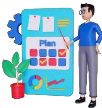
Figura 12. Elaborado por el autor

Planificar una práctica o clase debe ser una labor esencial en el día a día del docente esto garantiza que no llegamos a improvisar y proporciona al estudiante una herramienta para saber de qué se va a tratar la asignatura y como se la va a realizar, el hacer como eje del aprendizaje y la importancia de una práctica planificada para facilitar la comprensión. Propone actividades que promueven el rol activo del estudiante y fortalecen el trabajo colaborativo. Kaplún (2005) dice que los materiales educativos permiten examinar la realidad, unifican conocimientos previos, y fomentan el debate. Son útiles para transmitir información crítica y solucionar problemas reales.