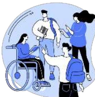
Figura 10. Elaborado por el autor

Desde nuestra formación médica tratamos con personas con condiciones diversas, donde formamos un entorno inclusivo, todos nuestros pacientes son iguales y los tratamos con el mismo cariño y respeto, en la vida diaria en las aulas de clases se fomenta el mismo respeto a todas las personas para formar mejores médicos, el diseño de las clases deben ser participativas en las que participen todos los estudiantes por igual, por otro lado he notado una evolución en las capacidades físicas de las universidades donde se incorporan medios que faciliten la incorporación de estudiantes y docentes con alguna discapacidad física por ejemplo la incorporación de ascensores, rampas y espacios en los salones de clase para sillas de ruedas.