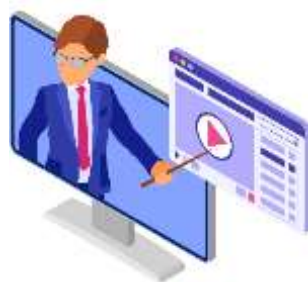
Figura 24. Elaborado por el autor

Sin embargo, con el tiempo, descubrí que la virtualidad también ofrecía oportunidades únicas para la innovación y la creatividad en la enseñanza. Aproveché herramientas de videoconferencia para mantener la interacción en tiempo real con mis estudiantes, utilizando recursos multimedia para enriquecer mis lecciones y fomentar la participación activa.