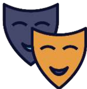
Figura 20. Elaborado por el autor

Moreno (2004) escribe sobre el humor en las aulas, como poder generar un mejor ambiente con los estudiantes sin llegar al humor negro, valiéndonos de esa herramienta para mejorar la relación con los estudiantes.