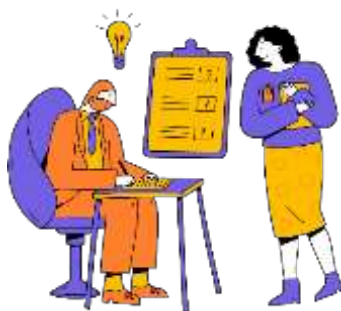
Figura 14. Elaborado por el autor

La propuesta educativa alternativa se centra en la apropiación de contenidos y una educación integral. La evaluación valora la síntesis, análisis, creatividad y cambio de actitudes. Se propone una metodología participativa y económica para validar mensajes educativos, a pesar de las objeciones. Cortés (1993) discute la importancia de la validación en la producción de mensajes educativos, a pesar de las objeciones sobre costos. Propone una metodología participativa y económica para analizar la percepción de materiales educativos en diversas comunidades.