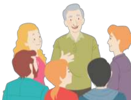
Figura 16. Elaborado por el autor

Cerbino et al. (2020) hace mención del término dimensión cultural , que se entiende por un proceso de construcción social, resultado de interacciones, prácticas y reconocer la diversidad de las expresiones culturales de todos los grupos, esto favorece al desarrollo humano en el ámbito del respeto y valoración de sus derechos humanos.