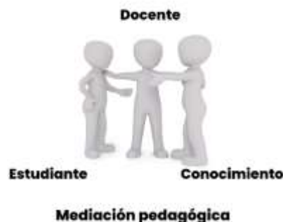
Figura 1. Elaborado por el autor

Finalmente, la mediación pedagógica ha logrado crear en mi un pensamiento diferente en el que me intereso que la información sea comprendida por la mayor cantidad de estudiantes evitando así las practicas tradicionales conocidas como cátedras.