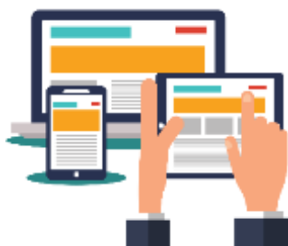
Figura 25. Elaborado por el autor

Como mediador, mi enfoque ha sido facilitar la integración efectiva de la tecnología en el aula, comenzando por comprender las necesidades y habilidades individuales de mis estudiantes. Esto implicó brindar orientación personalizada sobre cómo utilizar diversas plataformas y aplicaciones en función de los objetivos de aprendizaje y los estilos de aprendizaje de cada estudiante.