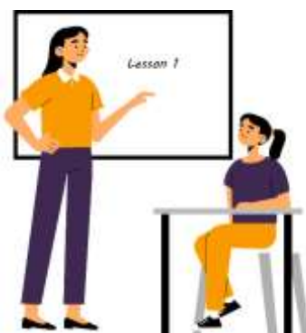
Figura 9. Elaborado por el autor

Debemos entender que una presentación bien estructurada es más importante que lo que se busca aprender, para que esto se pueda realizar necesitamos una ubicación temática, entrada motivadora, desarrollo con apelación a experiencias y a ejemplos, cierre adecuado al tema. La certidumbre revaloriza las capacidades ajenas, transmite confianza en sus destrezas, entrega herramientas para combatir la incertidumbre cotidiana (Prieto, 2019).