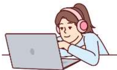
Figura 22. Elaborado por el autor

Al integrar las series de televisión en la enseñanza, los educadores pueden aprovechar el entusiasmo natural de los estudiantes por el entretenimiento para profundizar su comprensión de diferentes materias. Por ejemplo, una serie que aborde cuestiones sociales como la discriminación o la justicia puede servir como punto de partida para discusiones significativas en torno a temas de igualdad y derechos humanos en una clase de ciencias sociales.