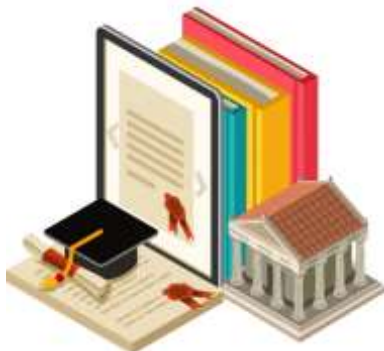
Figura 4. Elaborado por el autor

Brovelli (2005) propone concebir al currículum como un proyecto educativo de las universidades desde el punto de vista social, epistemológico, profesional y pedagógico didácticas, ofreciendo la flexibilidad para ser analizada y modificada en el tiempo para responder al rápido crecimiento del conocimiento.