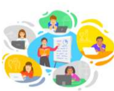
Figura 23. Elaborado por el autor

Como docente, mi trayectoria ha sido moldeada por el dinámico matrimonio entre la enseñanza tradicional y la vanguardia tecnológica. Desde mis primeros días en el aula, he abrazado la idea de que la tecnología puede ser un aliado poderoso en el proceso educativo. Recuerdo con claridad el momento en que introduje por primera vez una pizarra digital en mis clases; la reacción de los estudiantes fue palpable. La tecnología no solo capturó su atención, sino que también les brindó nuevas formas de interactuar con el material y entre ellos.