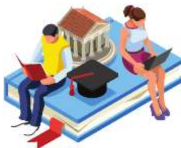
Figura 5. Elaborado por el autor

La relación de estudiantes, docentes, personal administrativo y otros constituyen la universidad, esto quiere decir que no es simplemente un lugar, sino las personas que la conforman, su relación con la sociedad sufre un cambio muy fuerte en el ámbito internacional, sociocultural, económico y tecnológico (Prieto, 2019)