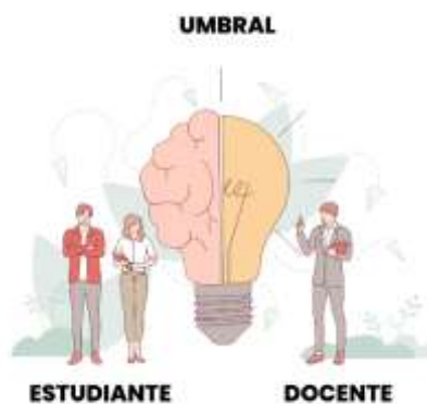
Figura 2. Elaborado por el autor

Debemos conocer el límite al que podemos llegar con las personas, es un campo que se debe trabajar en explorar hasta encontrar ese umbral donde se sientan seguros y nosotros también con ellos, sin llegar a invadir el espacio personal y tratando de cuidar la relación entre docentes y estudiantes.