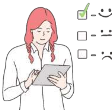
Figura 13. Elaborado por el autor

El juicio de valor es una opinión subjetiva basada en la evaluación, influenciada por los valores y creencias personales del individuo. Es crucial distinguir entre estos al evaluar algo o emitir un juicio de valor. Gómez (2021) discute el juicio de valor aplicado a un fenómeno o idea, refiriéndose a las relaciones de poder y la evaluación de certezas.