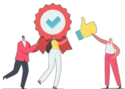
Figura 15. Elaborado por el autor

Cuando se solicita una validación, es importante entender qué hace nuestro proceso y qué características debe cumplir para ser efectivo. Esto puede implicar el diseño de un sistema para recoger datos y realizar los cálculos estadísticos necesarios para llegar a una conclusión, los resultados de la validación deben evaluarse para determinar si el proceso o método es adecuado. García (1986) propone que la validez de un método se refiere a su precisión para realizar mediciones significativas y adecuadas, midiendo realmente las variables que pretende medir.