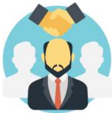
Figura 3. Elaborado por el autor

Un ejemplo de mediación cuando explico sobre climaterio y menopausia hago una comparación, al ovario con un cajero automático, el primero nos va a ofrecer mensualmente 1 óvulo durante el ciclo menstrual hasta que finalmente se le terminan y este deja de funcionar en la producción de hormonas, a esto le llamamos menopausia, al igual el cajero entrega dinero hasta que se le termina y deja de funcionar, este es básicamente el principio de la menopausia, de este ejemplo podríamos ampliarnos infinitamente ya depende de la profundidad a la que necesitemos llegar.