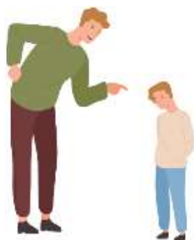
Figura 18. Elaborado por el autor

Uno de los desafíos que enfrento como docente es el de fomentar la participación y el diálogo con los jóvenes. He observado que muchos de ellos tienen miedo de expresar sus ideas ante sus maestros, lo que puede deberse a diversos factores, como las malas experiencias en el colegio, la educación familiar o la personalidad de cada uno. Creo que es importante crear un clima de confianza y respeto en el aula, donde los estudiantes se sientan escuchados, valorados y motivados. Sin embargo, no siempre es fácil lograrlo, pues también he tenido maestros que evitaban el diálogo por temor a perder su autoridad o a ser cuestionados.