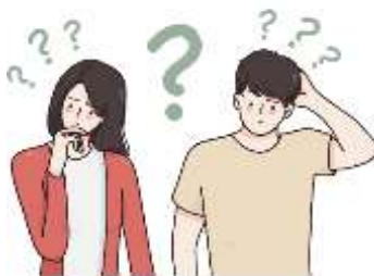
Figura 6. Elaborado por el autor

La educación en la universidad tiene como objetivo la promoción y el acompañamiento del aprendizaje, de múltiples formas ya sea leyendo o escuchando (Prieto, 2019), por otro lado, (Gutiérrez y Prieto, 1991) plantea las siguientes alternativas: educar para la incertidumbre, educar para gozar de la vida, educar para la significación, educar para la expresión, educar para convivir, educar para apropiarse de la historia, estos 6 puntos son fundamentales en la actualidad.