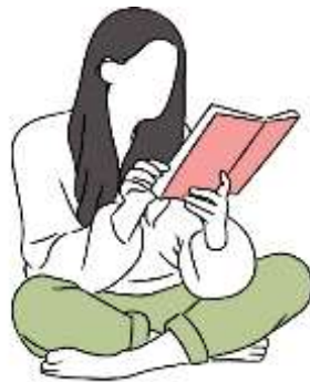
Figura 26. Elaborado por el autor

asumen su nuevo rol y se capacitan en educación a distancia, estos riesgos son superables. Se destacan herramientas como el correo electrónico, los foros y el chat como medios para fomentar la interacción y el aprendizaje cooperativo. Además, se discuten los estilos de aprendizaje y la importancia de adaptar la enseñanza a las preferencias individuales de los estudiantes. Se enfatiza la necesidad de integrar adecuadamente las TIC en la educación, pero se advierte que su mera presencia no garantiza la mejora educativa, subrayando la importancia de enfoques pedagógicos sólidos. Finalmente, se plantea la necesidad de una transformación en la educación hacia una perspectiva centrada en el estudiante y el aprendizaje activo, en lugar de simplemente transmitir información.