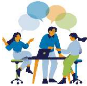
Figura 7. Elaborado por el autor

Existen múltiples formas de educar para y cada uno va descubriendo los beneficios de cada una de ellas la fusión de ellos permite un gran complemento para la labor de aprender, finalmente podemos ir creando nuevos educar para conforme se vayan presentando nuevos obstáculos que necesitemos resolver, y es nuestra labor encontrar nuevos educar para.