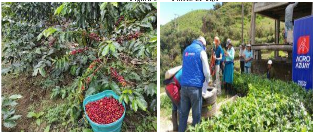
Figura 8 Fincas de Café

Las fincas de café se han vuelto un atractivo para muchos, especialmente en su época de carga esto hace que los visitantes puedan observar una infinidad de frutos rojos y amarillos el cual se puede palpar para sentir el sabor de la pulpa del café así también puedan tener una percepción sobre la cosecha y selección del grano, utilizando artesanías locales que hacen que la cosecha sea más cómoda. Otro beneficio que tiene este lugar para los visitantes son sus plantas frutales de diferentes productos como el guineo y el limón, así también la presencia de animales que se encuentran bajo el ecosistema.