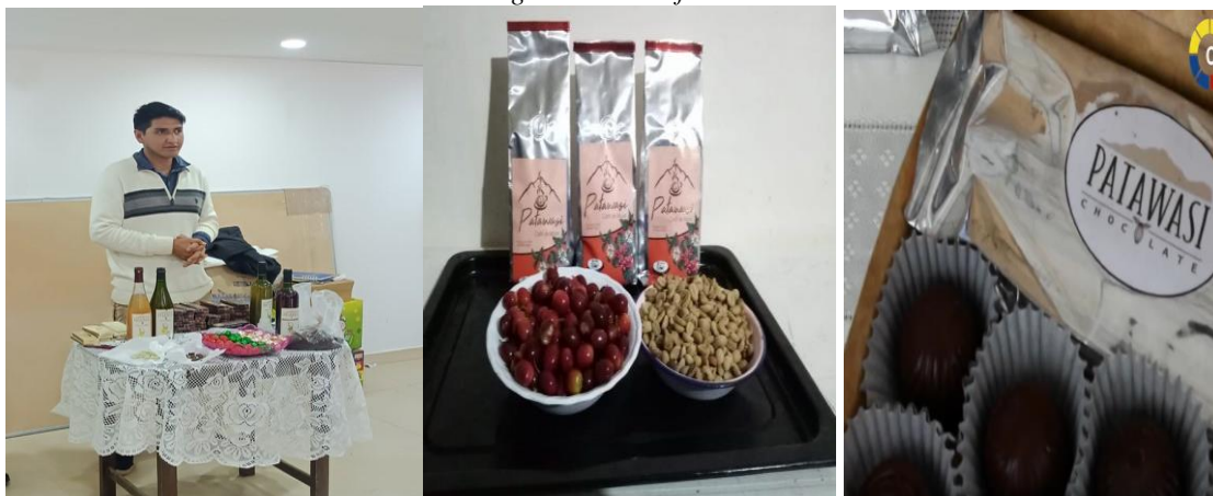
Figura 7 Café Patawasi.

Nota: Presentación del Café de altura Patawasi.