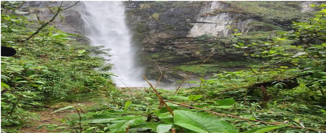
Figura 6 Chorrera de Jerez

Nota: Chorrera de Jerez afluente natural ubicado en Angas.