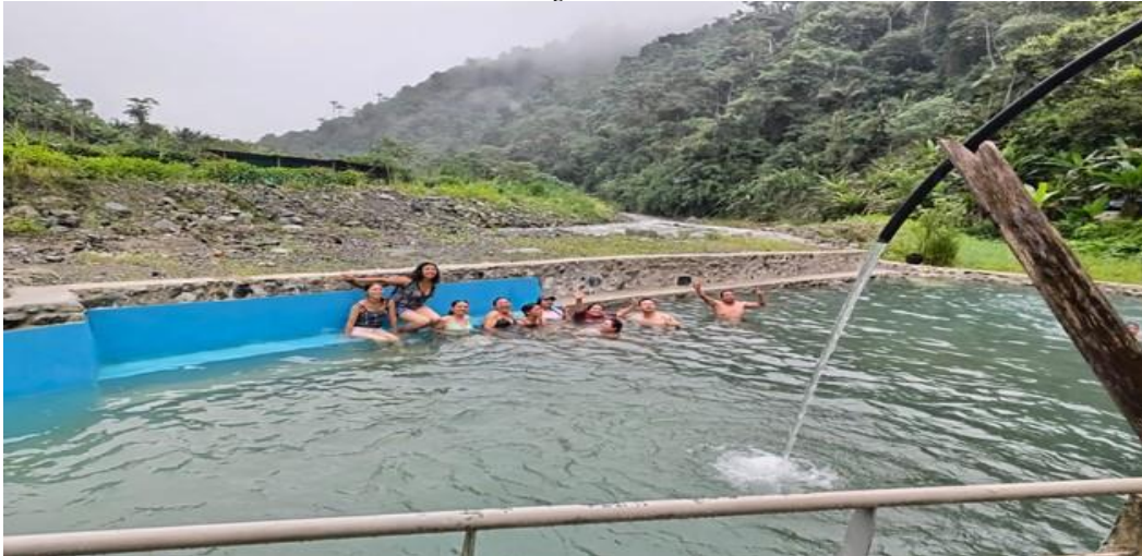
Figura 9 Termas

Nota: Aguas termales del volcán Patawasi.