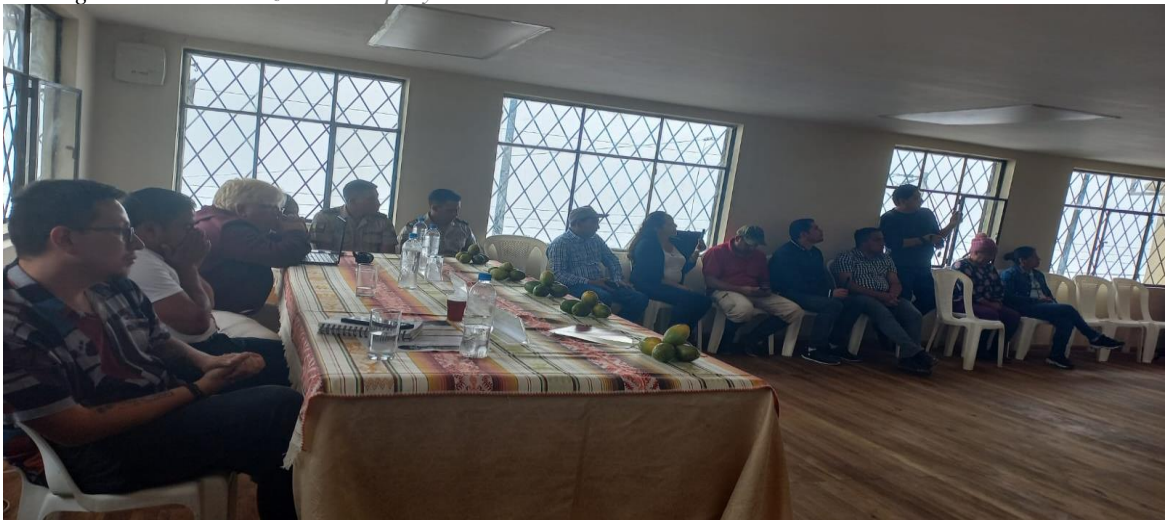
Figura 12 Socialización del proyecto

Nota: Socialización del proyecto “Ruta agroturística café Patawasi.