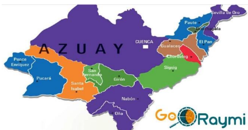
Figura 1 Mapa del Azuay

Respecto a la hidrografía de la parroquia Chaucha es bastante diversa, incluyendo lagunas, vertientes y quebradas, estas últimas contribuyen a la formación de varios ríos que desembocan tanto en el océano Pacífico como en el Atlántico. Un ejemplo notable es el río Balao, que se origina de las corrientes del río Chaucha, alimentado a su vez por la vertiente del río Angas. Otros ríos significativos de la zona son el Pujilí y el Galgal. En