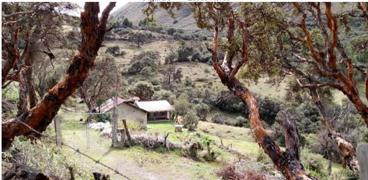
Figura 5 Los Arrieros

Nota: Estancia los Arrieros ex finca ganadera ahora convertida en un lugar de descanso.