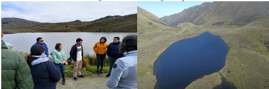
Figura 4 Visita a la laguna Nápale

Nota: Nápale viene de la palabra Nabo del aragonés medieval Napal. Tomado de (Chacho, Laguna Nápale , 2024)