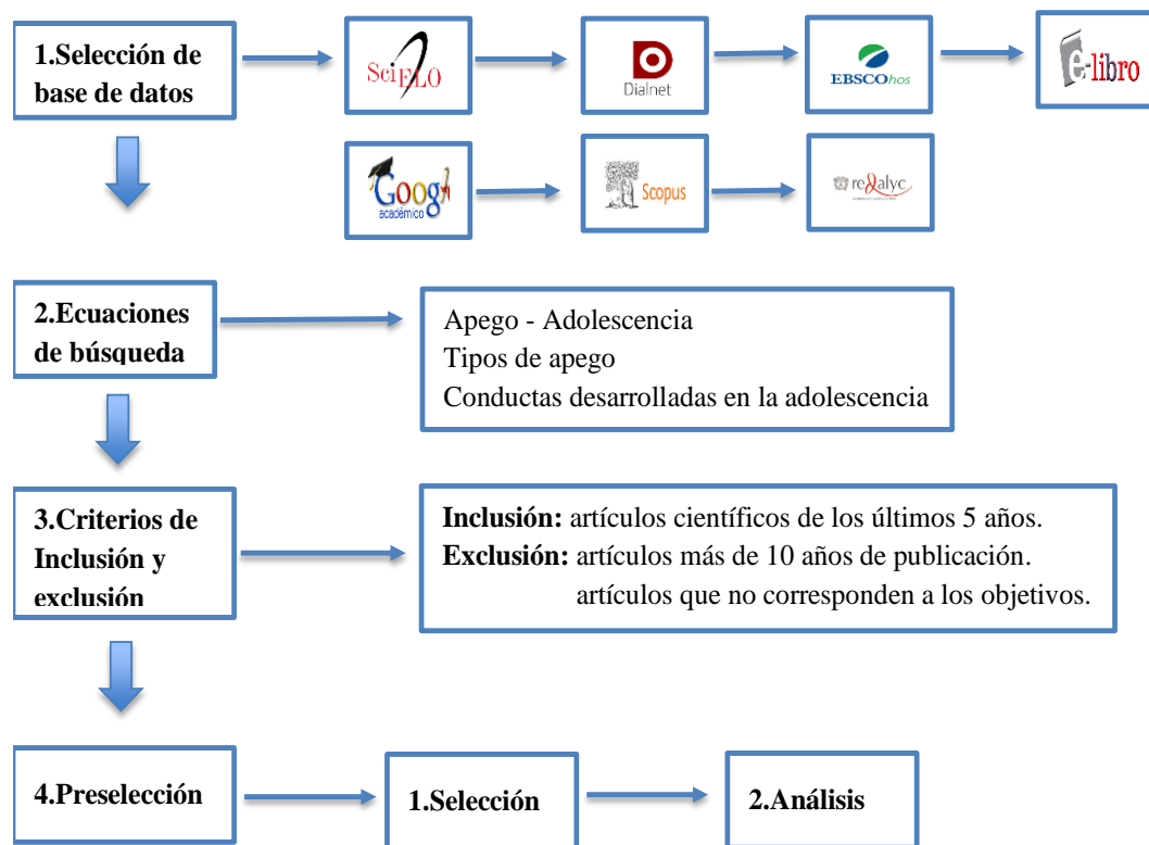
Diagrama de flujo del proceso de revisión sistemática.

Nota. Elaboración propia a partir de los estudios seleccionados y de la estructura propuesta por PRISMA (2021).