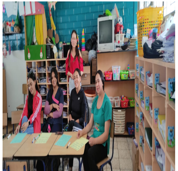
Taller Aprendizaje basado en estrategias motivadoras e innovadoras