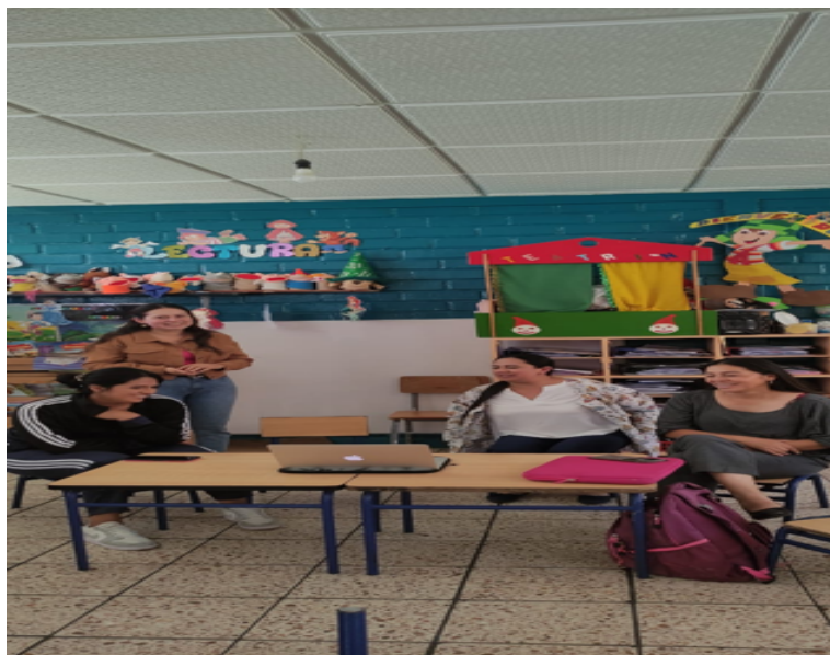
Foto No 5 Taller: Uso adecuado de técnicas que permitan a los estudiantes participar en la edificación del conocimiento