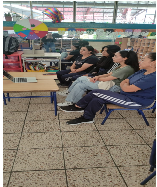
Foto No. 2 Taller Gestión del aprendizaje