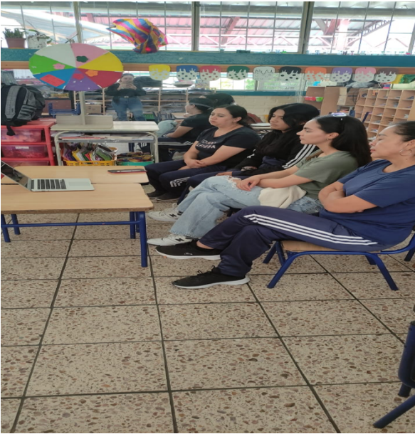
Foto No. 1 Taller Gestión del aprendizaje