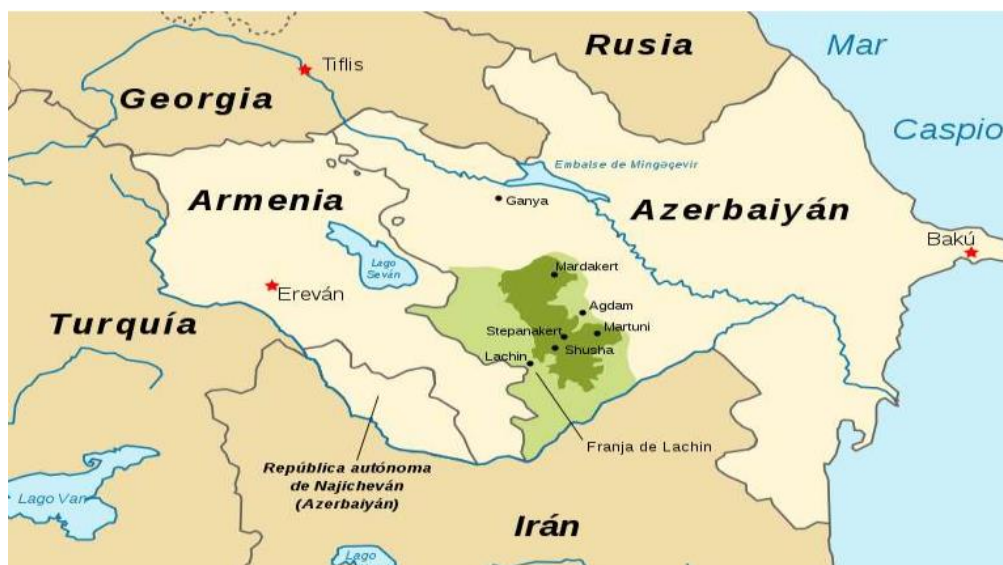
Figura 1 Zona de Nagorno Karabaj desde 1994

fuertes y cortas temporadas de verano. Esta región se encuentra conformada por tres áreas, la provincia de Syunik ubicada en la parte oeste y se caracteriza por contar con una gran meseta boscosa; al este se encuentran el bajo Karabaj y las orillas meridionales del río Kurá, y la zona central que divide al Alto Karabaj del Bajo Karabaj, caracterizada por ser una zona altamente montañosa (Reyes, 2021).