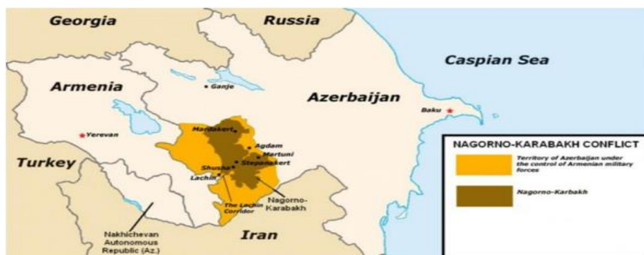
Figura 3 Mapa de Nagorno Karabaj antes de la reanudación del conflicto armado en septiembre.