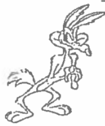
WILE E. COYOTE

WILE E. COYOTE signo protegido por la Dirección Nacional de Propiedad Industrial del Ministerio de Industrias, Comercio, Integración y Pesca (IEPI) a favor de WARNER BROS ENTERTAINMENT INC.