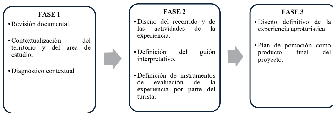
Figura 1 Esquema explicativo de las fases metodológicas de la investigación

A continuación, se presentará un esquema en donde se explicarán de manera resumida las fases antes mencionadas sobre la metodología de investigación de este proyecto: