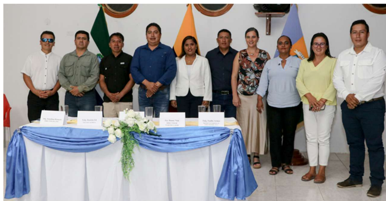
Elaboración propia (2026)