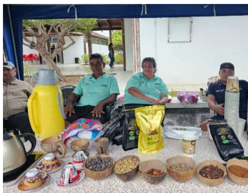
Elaboración propia (2026)