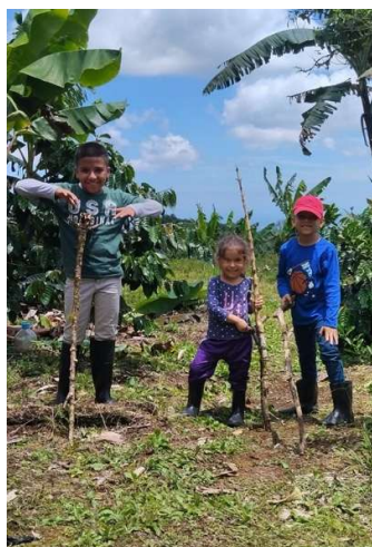
Elaboración propia (2026)