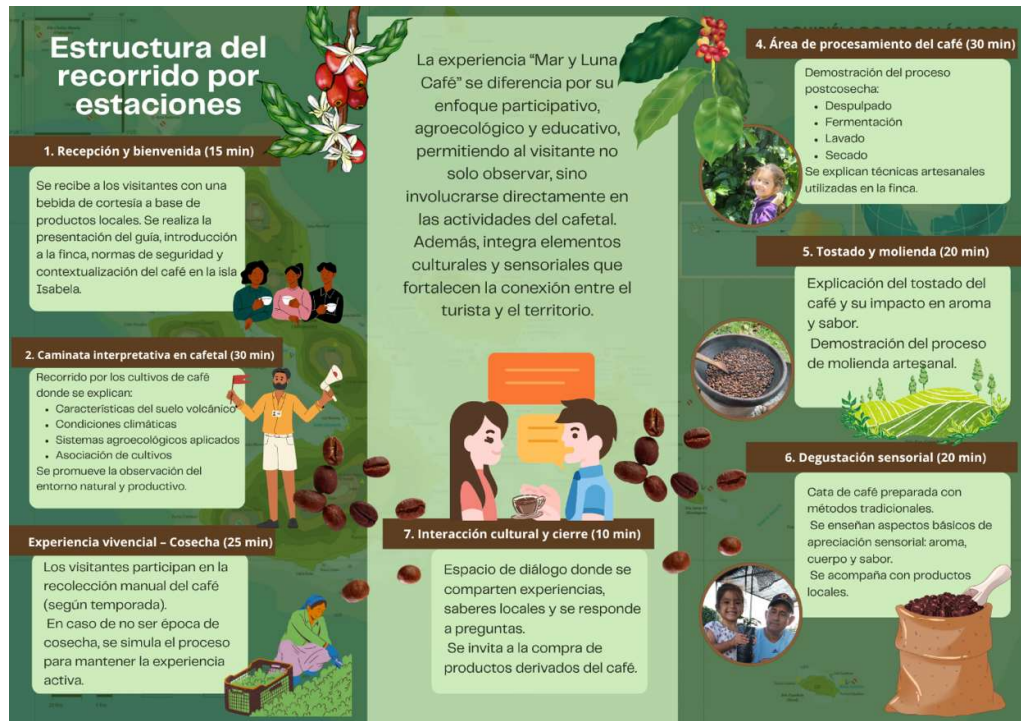
Figura 17 Flyer promocional cara posterior