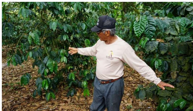
Figura 2 Trabajador del agro en la finca Mar y Luna

El agroturismo comenzó a posicionarse como una alternativa complementaria, permitiendo integrar la producción agrícola con experiencias vivenciales para los visitantes. Algunos emprendimientos locales empezaron a abrir sus fincas para mostrar sus procesos productivos, especialmente los relacionados con el café, lo que dio lugar a los primeros acercamientos al turismo rural en la isla (PDOT Isabela, 2023). En la figura 2 se muestra a un trabajador de la finca Mar y Luna explicando a los visitantes el manejo de las plantaciones de café y en la figura 3 se muestra el paisaje que se puede observar desde el mirador de la finca: