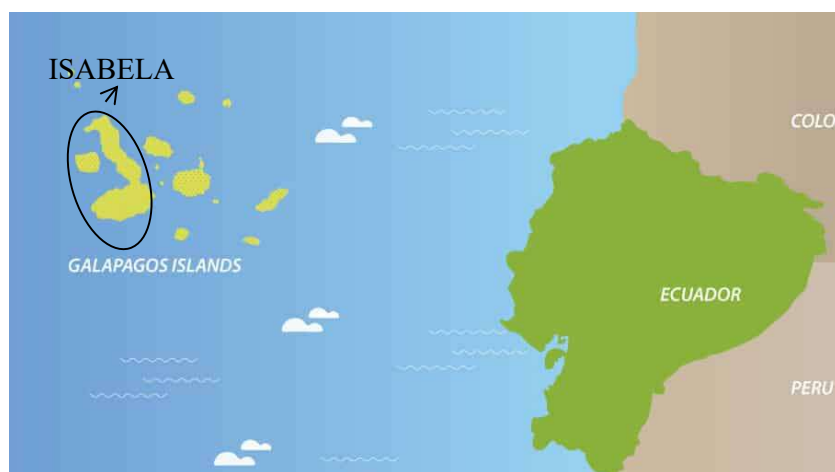
Figura 6 Ubicación de las islas Galápagos

Basado en: Islands Travel Tourism (2020)