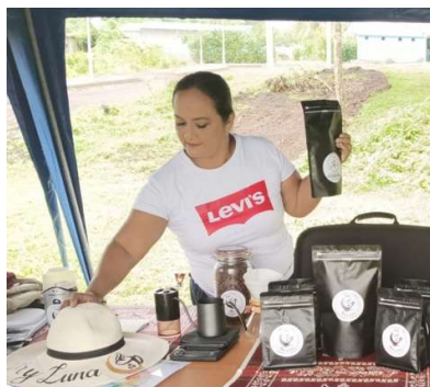
Elaboración propia (2026)