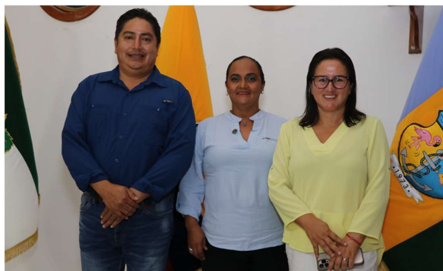
Elaboración propia (2026)