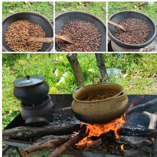
Figura 10 Proceso artesanal del tueste de granos de café en la finca Mar y Luna

Finalmente, la experiencia culmina en un momento de cierre que integra lo emocional y lo simbólico. El visitante recibe una pequeña bolsita de café molido que él mismo prepara, acompañada de una tarjeta en la que puede expresar sus sensaciones y aprendizajes. Este episodio se complementa con un espacio fotográfico en un mirador natural, desde donde se aprecia el paisaje rural de Isabela, lo que propicia una reflexión sobre la relación entre el territorio, el café y la sostenibilidad. De esta manera, se consolida una experiencia significativa que trasciende lo turístico y promueve una conexión consciente con el entorno y la cultura local. En la figura 11 se aprecia el proceso de tueste artesanal de los granos de café en la finca Mar y Luna como parte de la experiencia de elaboración de café orgánico