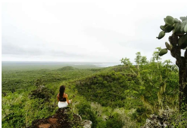
Figura 3 Vista del paisaje abierto en finca Mar y Luna