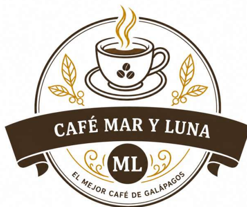
Figura 15 logotipo del cafetal Mar y Luna