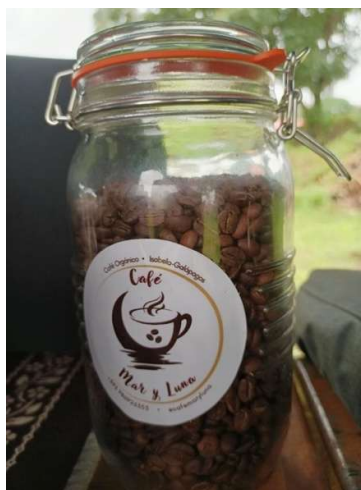
Elaboración propia (2026)