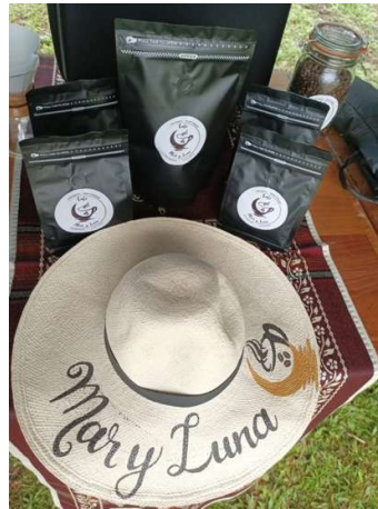
Elaboración propia (2026)

En la figura 12 se observa la presentación del café orgánico en envase de vidrio el cual garantiza la conservación del aroma y sabor mediante un sellado hermético, esta presentación resalta la calidad artesanal de la marca utilizando un empaque reutilizable con valor estético.