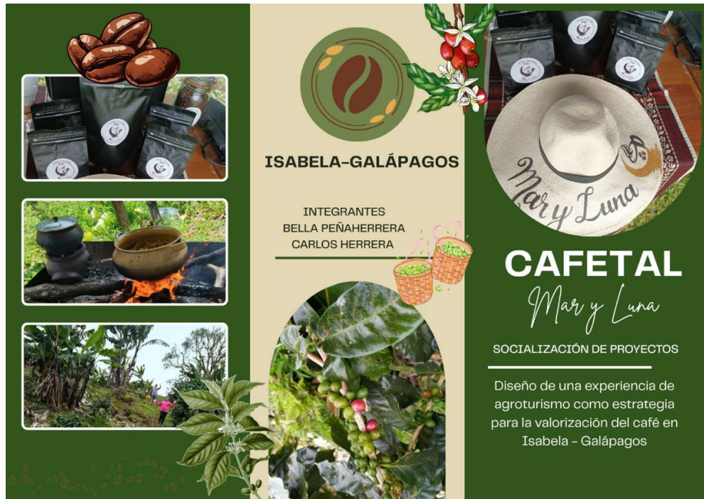
Figura 16 Flyer promocional cara frontal