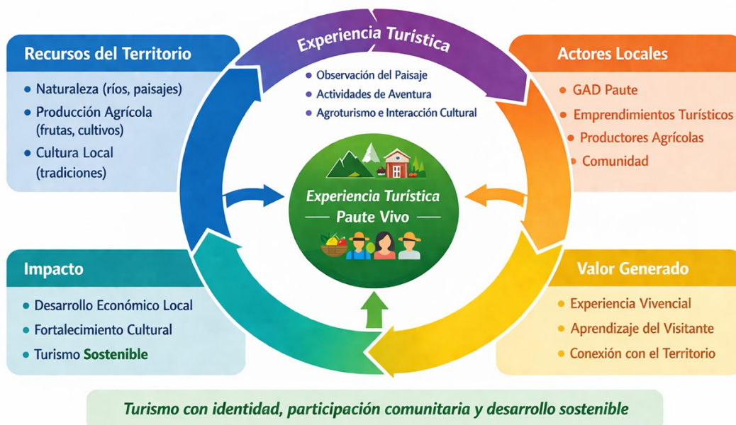
Cuadro de gestión territorial del proyecto Paute Vivo