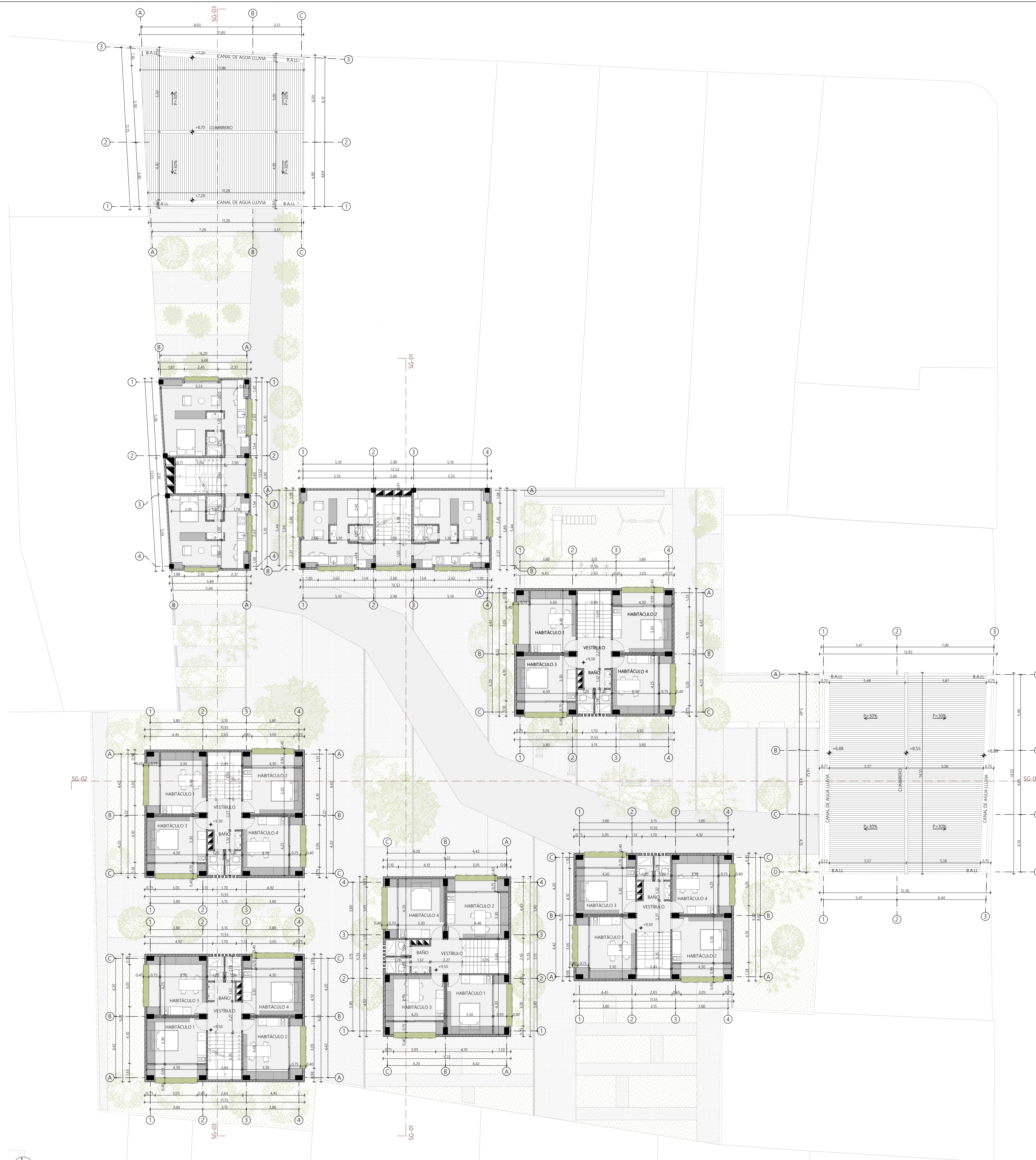
PLANTA ALTA 3 1:150