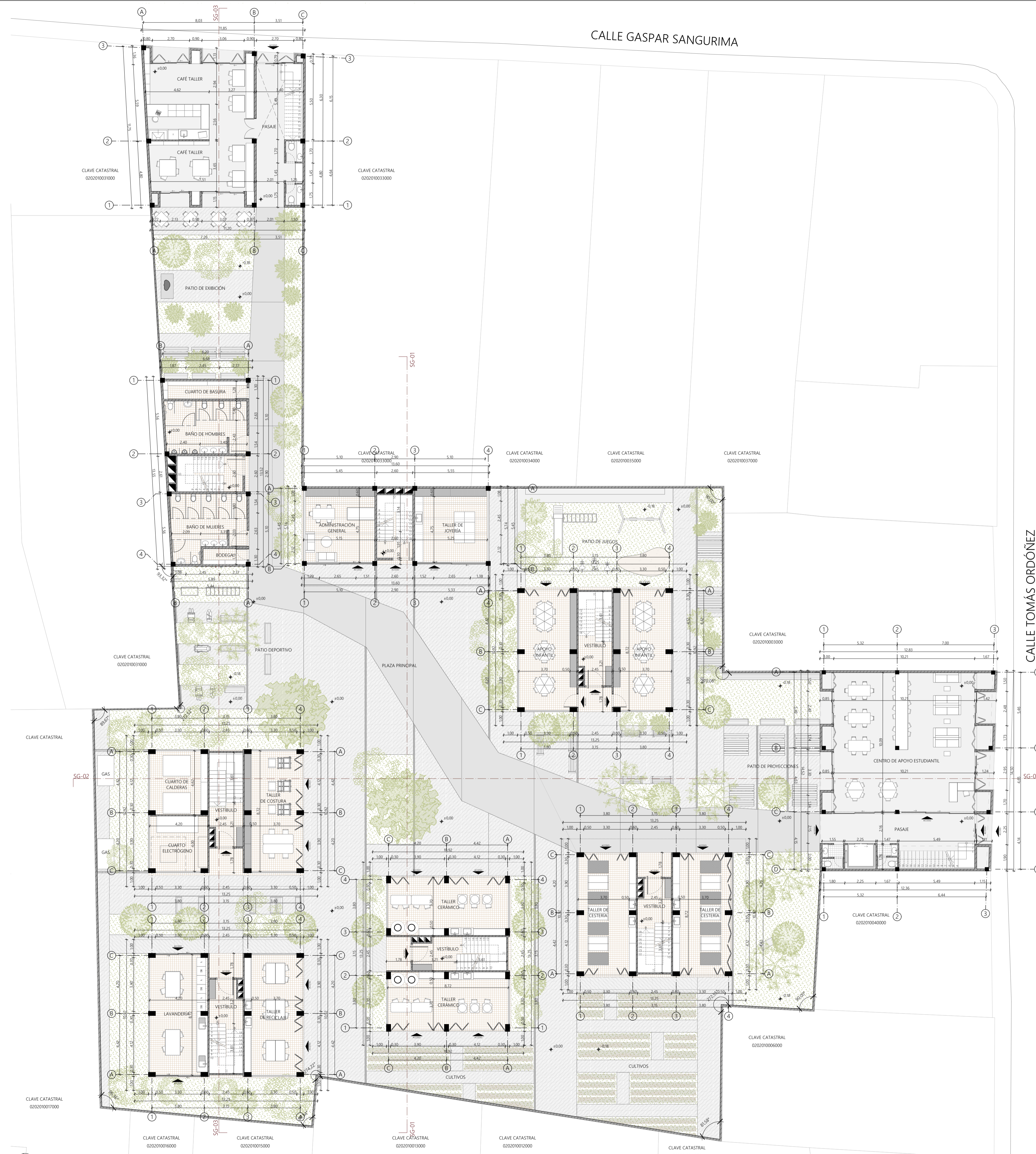
PLANTA BAJA 1:150