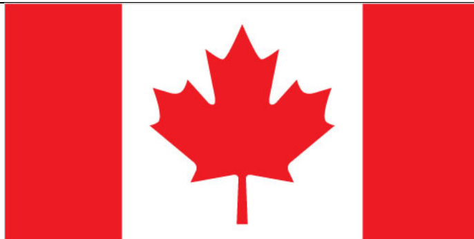
Imagen N° 5: Elaborado por “Central Intelligence Agencia” (CIA).

https://www.cia.gov/library/publications/the-world-factbook/geos/ca.html