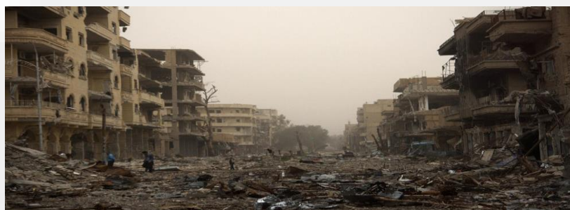
Imagen N°8: Elaborado por Taringa, La cruda realidad de Siria.

http://www.taringa.net/post/imagenes/16502029/La-cruda-realidad-de-Siria-luego-de-2-anos-de-guerrilla.html