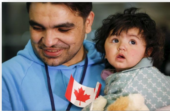
Imagen N° 12: Elaborado por “EuropaPress” (2016).

http://www.europapress.es/internacional/noticia-refugiados-sirios-auxilian-victimas-incendio-fort-mcmurray-canada-20160506143813.html