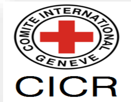
Imagen N°4: Elaborado por “Comité Internacional de la Cruz Roja”.