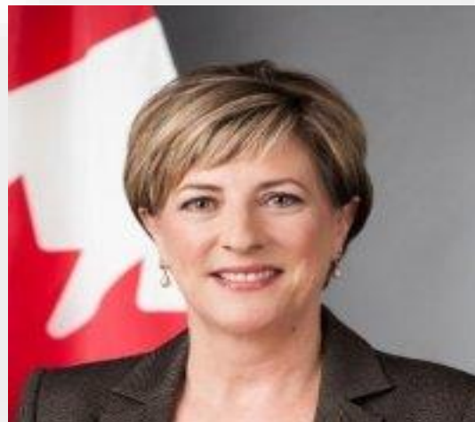
Imagen N°10: Elaborado por la “Cancillería – República de Colombia” (2014).

http://www.cancilleria.gov.co/newsroom/news/nueva-embajadora-canada-colombia-entrego-sus-cartas-credenciales-al-presidente-juan