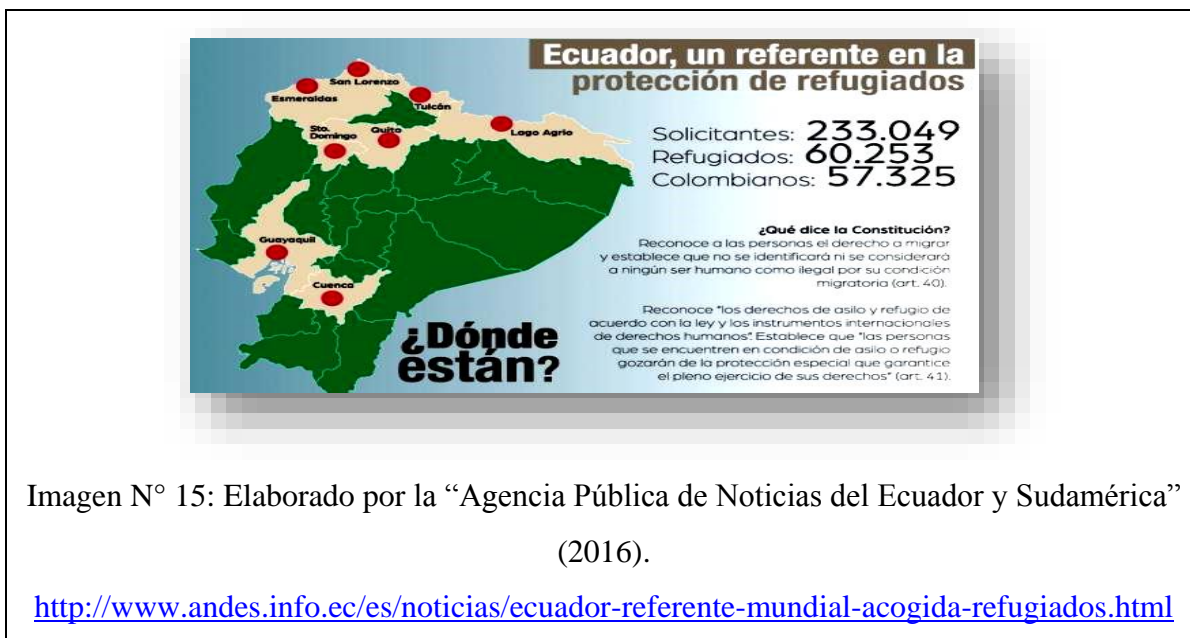
Imagen N° 15: Elaborado por la “Agencia Pública de Noticias del Ecuador y Sudamérica” (2016).

http://www.andes.info.ec/es/noticias/ecuador-referente-mundial-acogida-refugiados.html