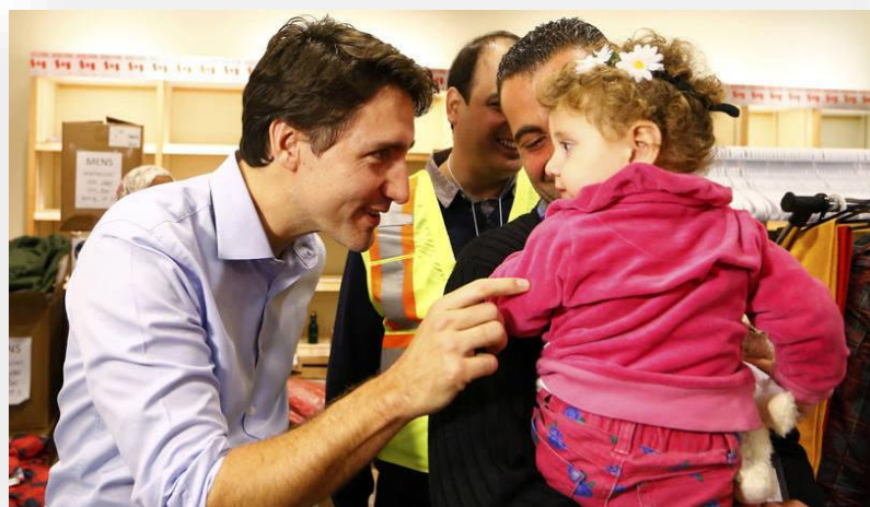
Imagen N° 11: Elaborado por “NM Noticias” (2015).

http://nmnoticias.ca/159704/video-llegada-refugiados-sirios-canada-justin-trudeau-toronto/