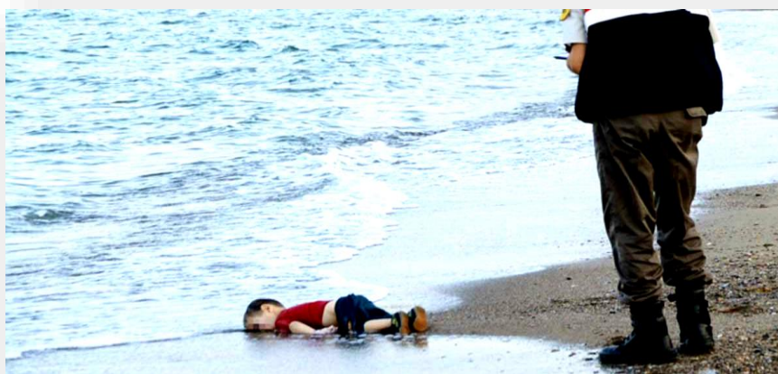
Imagen N° 9: Elaborado por Candela Duato, UPSOCL.

http://www.upsocl.com/comunidad/la-cruda-realidad-detras-de-la-impactante-fotografia-del-nino-sirio-ahogado-en-la-costa-de-turquia/