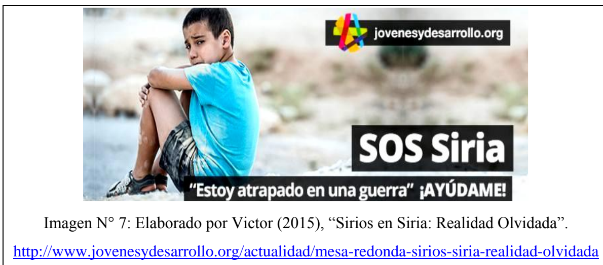
Imagen N° 7: Elaborado por Victor (2015), “Sirios en Siria: Realidad Olvidada”.

http://www.jovenesydesarrollo.org/actualidad/mesa-redonda-sirios-siria-realidad-olvidada