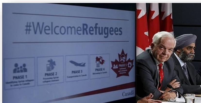
Imagen N°6: Elaborado por “ABC Internacional” (2015).

http://www.abc.es/internacional/abci-canada-no-aceptara-hombres-solteros-entre-refugiados-sirios-201511280123_noticia.html