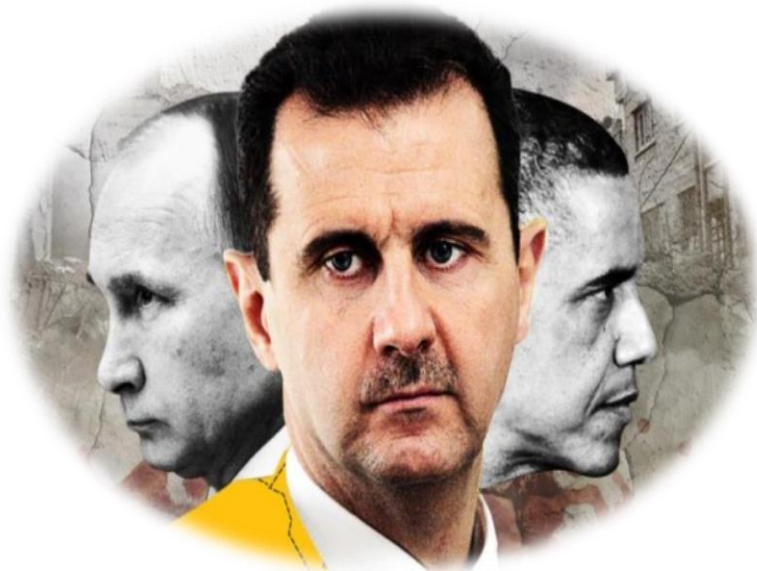
Imagen N° 14: Elaborado por Pablo Jofré Leal (2016), “Cantos de sirena para una tregua engañosa - Siria”.

http://www.resumenlatinoamericano.org/2016/03/04/siria-cantos-de-sirena-para-una-tregua-enganosa/