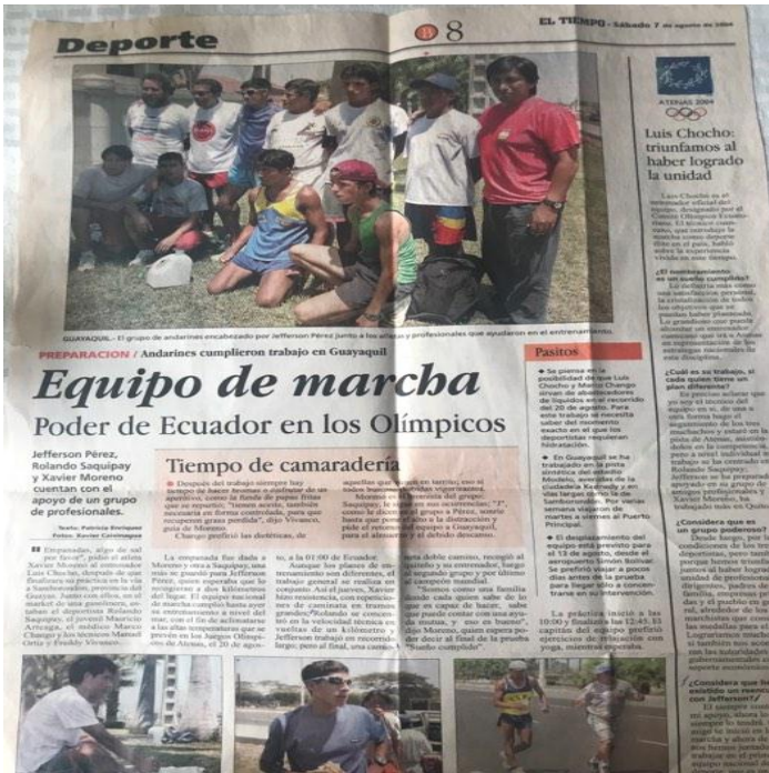
Publicación del Sábado 7 de agosto de 2004