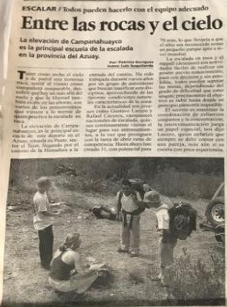
PARA EL ASCENSO a la montaña se debe llevar equipo en mochilas grandes y cómodas.