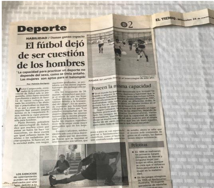
Publicación: miércoles 24 de marzo de 2004